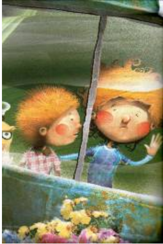
Imagen # 7 Autor: Yody Castro, Tomado de: Fabio Enrique Barragán Santos, La casa embudada , Bogotá, Panamericana, 2009, p.86.

Aunque el miedo es un elemento significativo, el tema de la muerte es lo central de La casa embudada . La muerte es uno de esos temas tabú que en la literatura infantil, durante muchas décadas, no se trató por considerarse fuerte y doloroso, o por tener la idea de unos niños y niñas incapaces de entender asuntos tan complejos la pérdida de un ser querido.