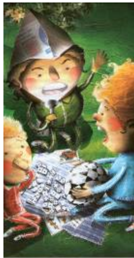
Imagen # 8, Autor: Yody Castro, Tomado de: Fabio Enrique Barragán Santos, La casa embudada , Bogotá, Panamericana, 2009, p. 27.

Sin embargo, al hablar del juego se genera una línea divisoria entre los personajes niños y niñas; por ejemplo: Felipe, su hermano menor y su primo Gabriel cuentan historias de miedo, juegan dominó, cartas, pero sobre todo fútbol, que también está presente en otras de las obras infantiles hasta aquí trabajadas.