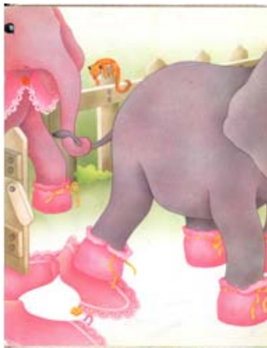
Imagen # 1, Autor: Nella Bosnia, Tomado de: Adela Turín y Nella Bosnia, Rosa Caramelo , Barcelona, Lumen, 1976, p. 29.

Por ejemplo, Rosa Caramelo es la historia de la elefantita Margarita. Ella hace parte de una manada donde las hembras son suaves, rosadas, de ojos grandes y brillantes, gracias a las flores de anémonas y peonías que estaban obligadas a comer a pesar de su desagradable sabor, todo con el fin de no tener la piel gris de los elefantes machos.