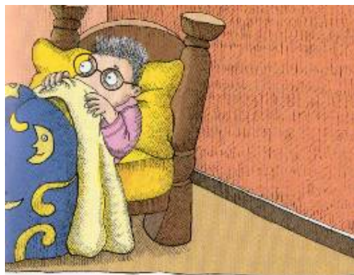
Imagen # 6, Autor: Ivar Da Coll, Tomado de: Yolanda Reyes, Una cama para tres , Bogotá, Alfaguara, 2007, p.16

Ni las aguas de lechuga de la abuela, ni los jarabes del médico, ni la ayuda de una experta en pesadillas, ni los regaños, logran que Andrés superare el miedo; antes bien, ha contagiado del mismo mal a su padre que tampoco es capaz de estar solo en la cama: