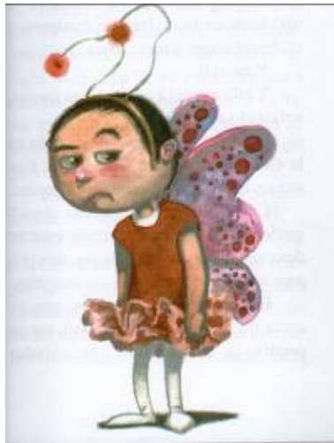
Imagen # 14, Autor: Pablo Pincay, Tomado de: María Fernanda Heredia, Fantasmas a domicilio , Quito, Alfaguara, 2006, p. 35

Es el caso de Lucas, quien después de ser un fracaso en el fútbol, ninguno de los compañeros le volvió a hablar. Las niñas, en cambio, le guardaban algo de cariño, así que lo invitaron a bailar una coreografía que se llamaba “Mariposas en abril”.