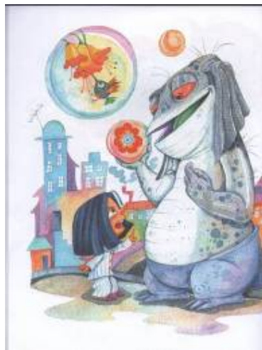
Imagen # 4, Autor: Guido Chaves, Tomado de: Edgar Allan García, Los sueños de Avelina , Quito, Alfaguara, 2009.p. 24

Al defender sus sueños de Godofredo, Avelina se muestra como una niña valiente (imagen #4) que, a pesar de su pequeña estatura, en comparación de su opresor, toma la decisión de enfrentarse sola al monstruo: