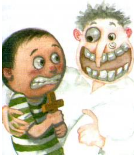
Imagen # 5, Autor: Pablo Pincay, Tomado de: María Fernanda Heredia, Fantasmas a domicilio , Quito, Alfaguara, 2006, p. 47.

Colomer asegura que los personajes niños en la literatura infantil actual tienen características más amplias. Los cambios culturales se reflejan en la literatura y permiten que los personajes masculinos sean “sujetos de temas intimistas, poéticos y de conflictos psicológicos”. 26 Sin embargo, esa ampliación de las características masculinas no comprende las tareas domésticas. Aunque hay algunas excepciones, los personajes masculinos no asumen las tareas del hogar como suyas.