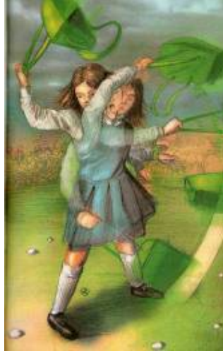
Imagen # 3, Autor: José Rosero, Tomado de: Evelio Rosero Diago, Pelea en el parque, El sueño de Tacha , Bogotá, El Barco de Vapor, 2009, p.25

donde ha dejado de aferrarse a su maletín por el miedo que le invadía y volverlo un objeto de defensa y lucha.