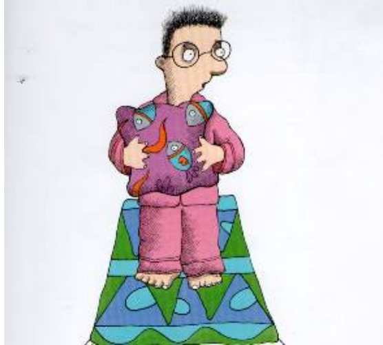
Imagen # 9, Autor: Ivar Da Coll, Tomado de: Yolanda Reyes, Una cama para tres , Bogotá, Alfaguara, 2007, p.5.

De los niños que encontramos en nuestro corpus de obras infantiles, es importante resaltar que al ser protagonistas de las historias, se caracterizan por ser niños dóciles, tiernos, obedientes y dependientes y, sobre todo, miedosos, como podemos constatar en las ilustraciones que representan a Andrés (Imagen # 6 y 9), a Lucas (Imagen # 5) y a Sebastián y Felipe (Imagen # 7 y 8).