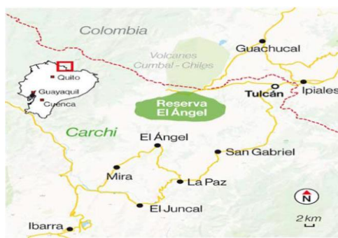
Mapa de los departamentos/ provincias fronterizas: Ecuador- Colombia