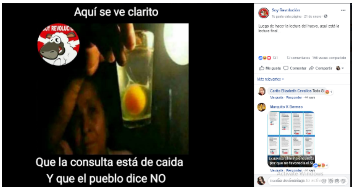
Gráfico 4 Meme 2 Soy Revolución: Aquí se ve clarito