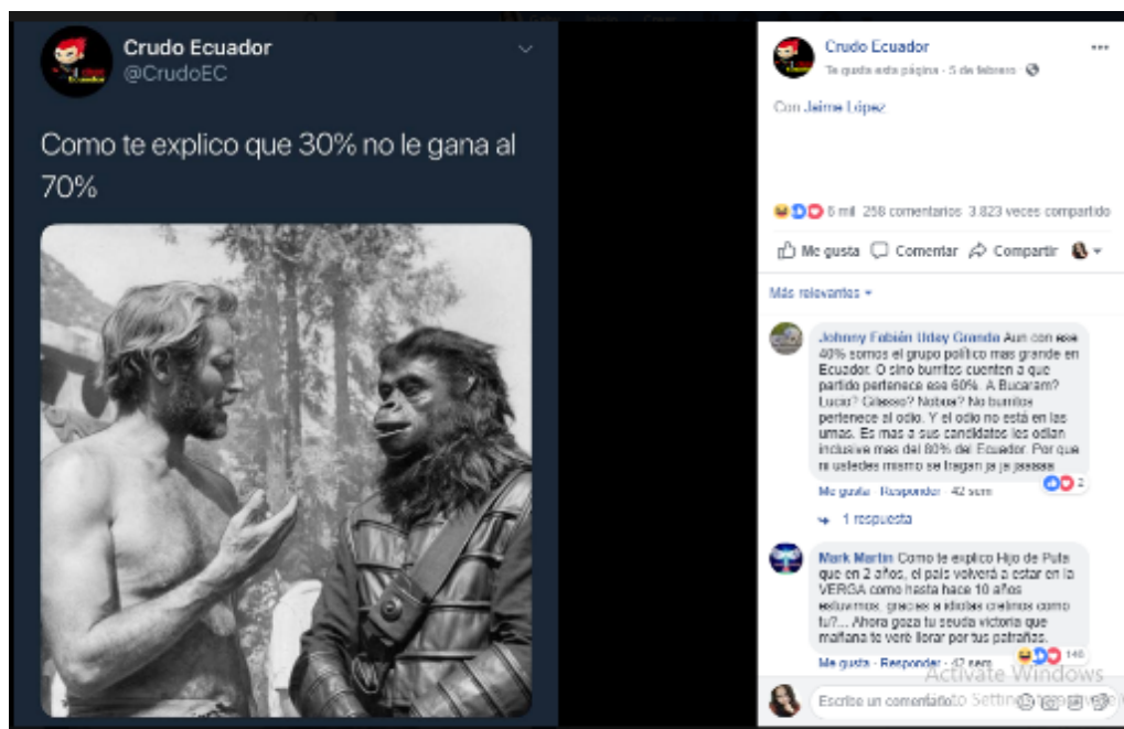
Meme 1: Meme sobre el porcentaje de votación del SI y NO en la Consulta del 2018