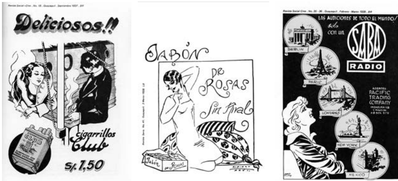
Ilustración 2 12

El niño Víctor Jácome pasó de las imágenes de la iglesia y el libro de catecismo a los anuncios de prensa con grabados de dibujos que paulatinamente fueron incorporando fotografías tramadas con un punto muy grueso, colores planos y posteriormente litografías. Un trabajo complejo que adelantaba la importancia de la publicidad y uno de cuyos mejores instrumentos de venta sería la exhibición de imágenes de mujeres. Jácome asegura que «[...] uno se graba las imágenes», y sin duda aquello generó una estética particular que se manifiesta luego en su obra personal.