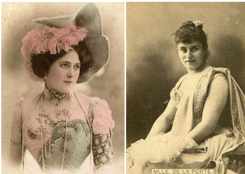
Ilustración 7 23

Casi siempre las postales en referencia tenían origen francés, aunque también había mexicanas e italianas; en ninguna de ellas se leía la palabra prostituée porque más bien se las asociaba con las actrices de ciertos géneros teatrales. De seguro las más recordadas cortesanas y de quienes circularon millones de postales fueron las tres divas: Agustina Otero Iglesias, cuyo pseudónimo fue La Bella Otero ; Emilienne D'Alencon y Liane de Pougy, afamados personajes de la belle époque francesa, a pesar de que Otero era de origen español.