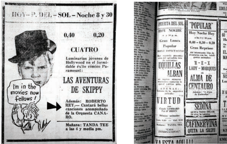
Ilustración 5 16

The Kid es una de las películas citadas por Jácome; muchos años después sigue recordando con regocijo cómo el niño actor Jackie Coogan