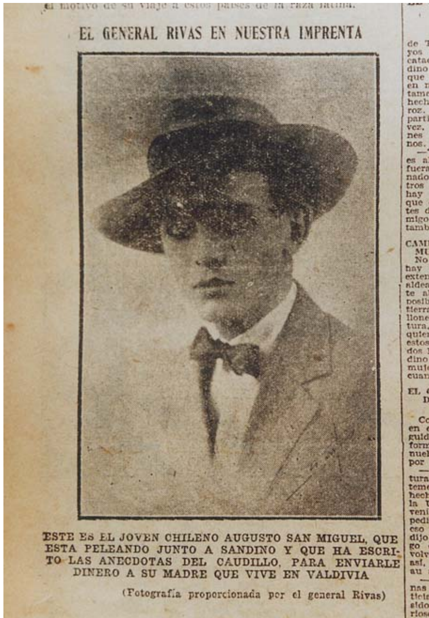
Augusto San Miguel Reese, diario Últimas Noticias , Santiago de Chile, 3 de marzo de 1930, pp. 6-7.