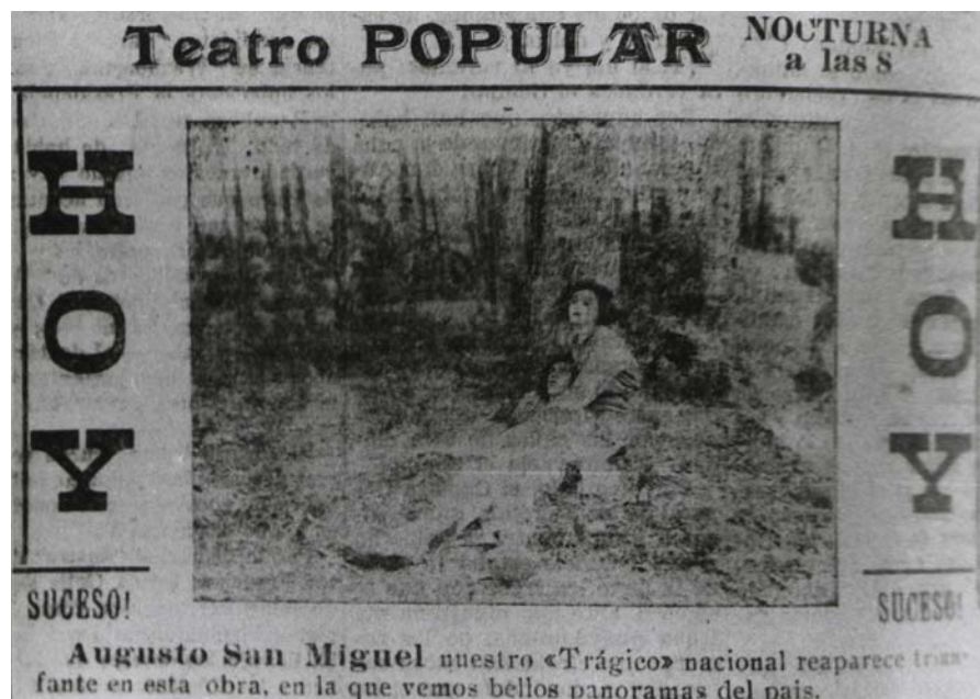
Augusto San Miguel en argumental Un abismo y dos almas , 1925