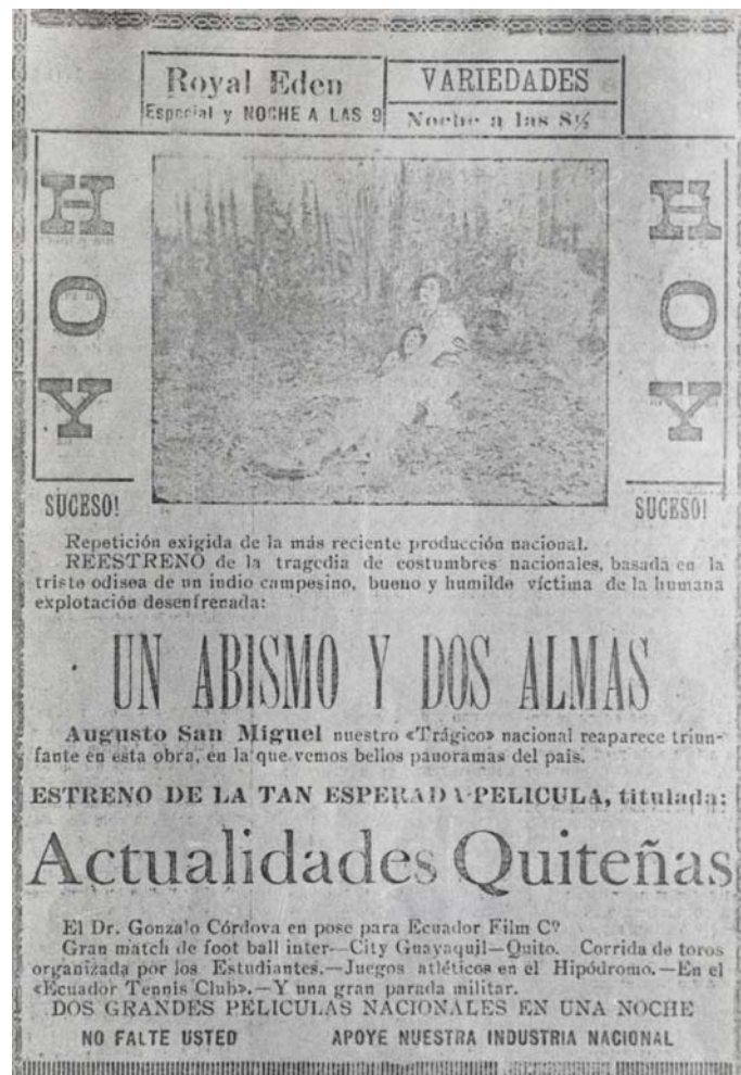
Anuncio argumental Un abismo y dos almas , 1925