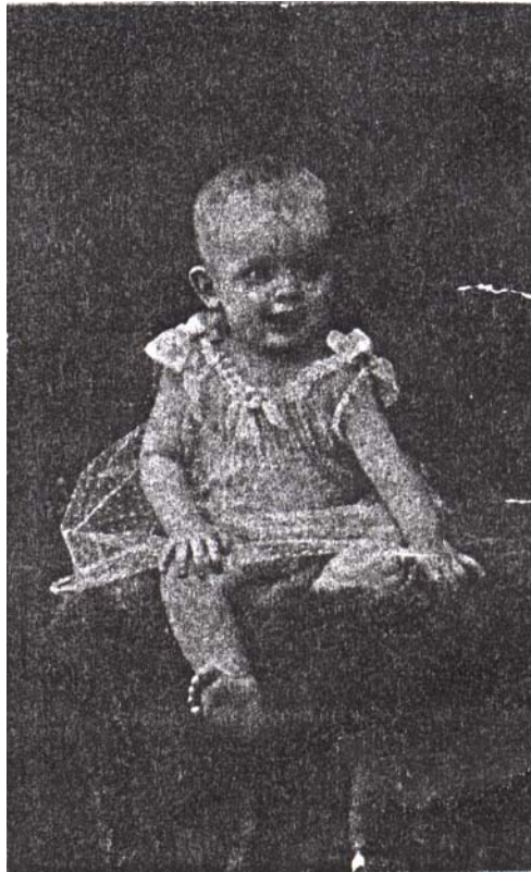
Augusto San Miguel, Guayaquil, 1906