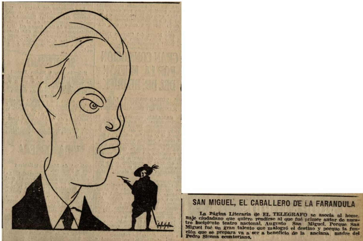
Caricatura de Galo Galecio para Augusto San Miguel, Guayaquil, 1937