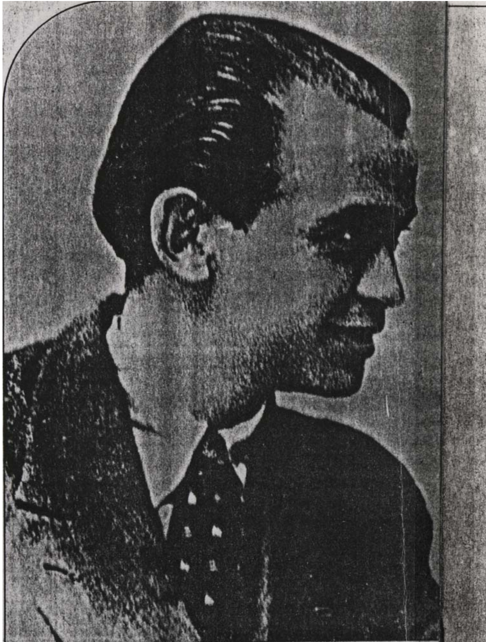
Augusto San Miguel, Guayaquil, 1930