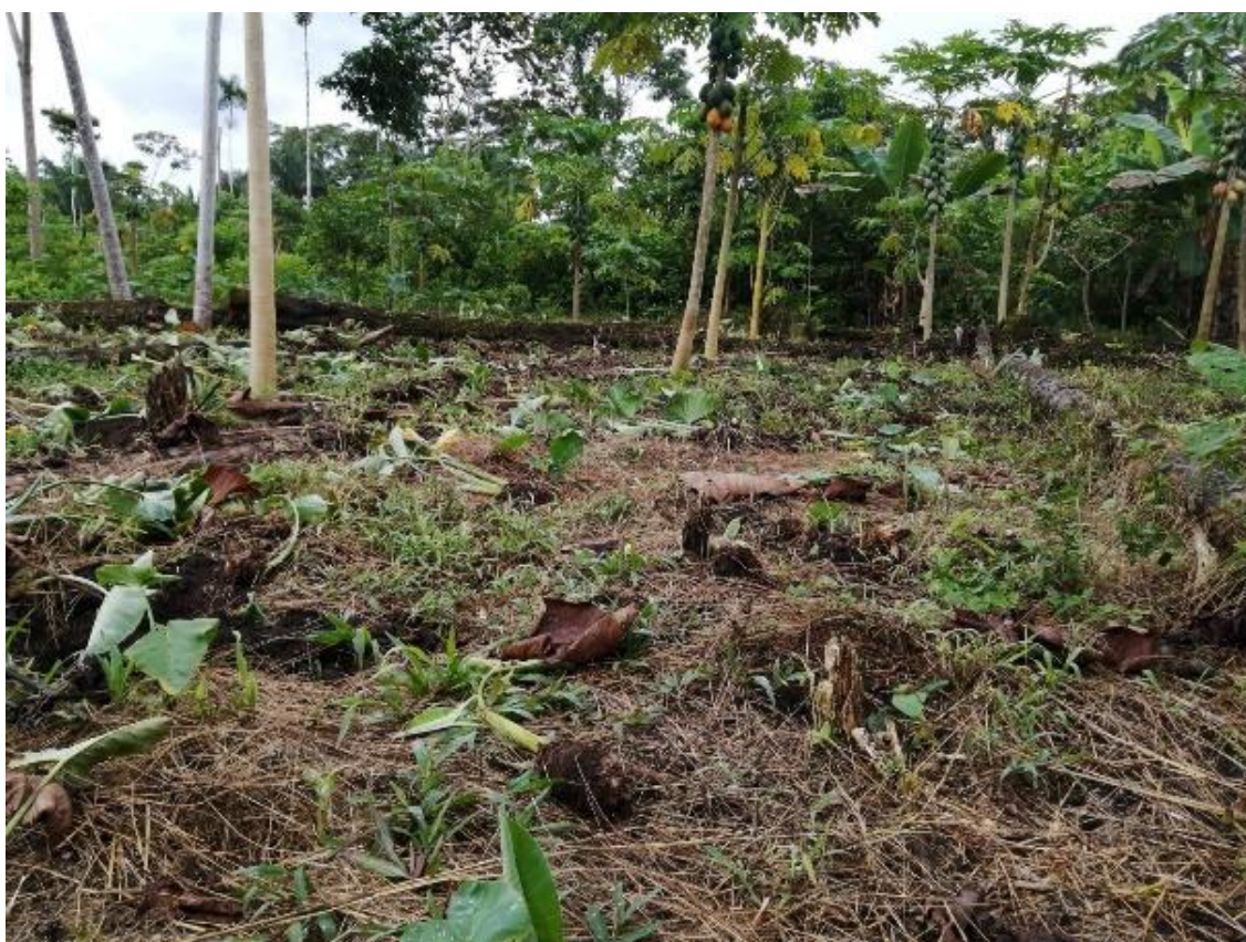
Figura 4. Área cosechada de la malanga