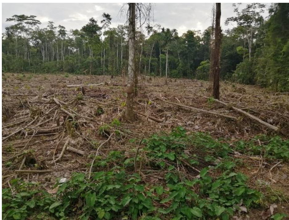
Figura 1. Área talada y repicada listo para sembrar la malanga

Los A'í Kofán por ser “un pueblo tradicionalmente de bosque húmedo tropical emigraba frecuentemente de un lugar a otro, con una numerosa población”. 40