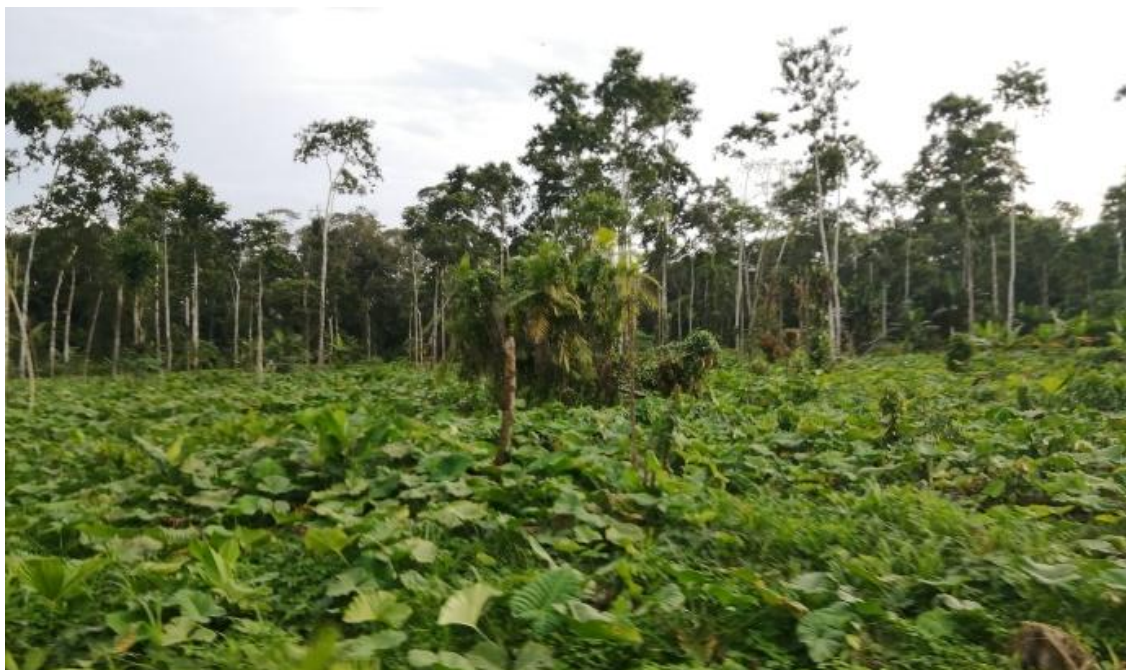
Figura 3. Plantación de malanga a tiempo de la cosecha