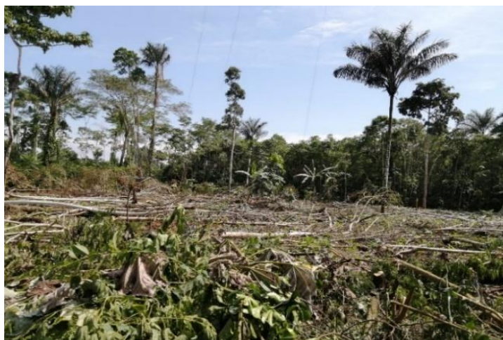
Figura 2. Tala de bosque para sembrar la malanga

En la comunidad A'í Kofán Duvuno antes de la entrada de los productores de la malanga era común ver los inmensos árboles de ceibo en la carretera y en los alrededores de las casas. A demás árboles maderables como: laurel, caoba, bálsamo, guayacán, cedro, chuncho etc.; se encontraba cerca de las chacra o fincas. Estos árboles en la actualidad no se encuentran comúnmente y tal vez, se puede encontrar muy poco en áreas no intervenidas para la explotación de madera y sembríos de la malanga. El bosque verde exuberante ha desaparecido, ahora se ve solo pequeñas manchas como pequeñas islas y en sus alrededores el consumo del ser humano que ha talado los árboles para el sembrío de la malanga (monocultivo). Es lamentable esta rápida depredación de bosque porque hoy en día los comuneros no tienen madera para diversos usos necesario del hogar.