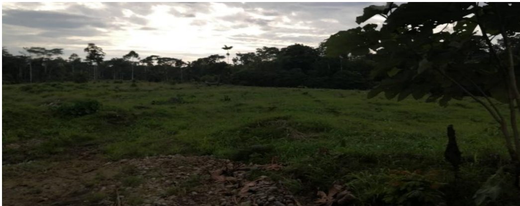
Figura 3. La maleza arrozillo después de cosechar la malanga

Es una hierba que invade en todos los terrenos utilizado para sembrar la malanga. “Este pasto es una de las malezas tropicales más serias en todas las partes del mundo. Es