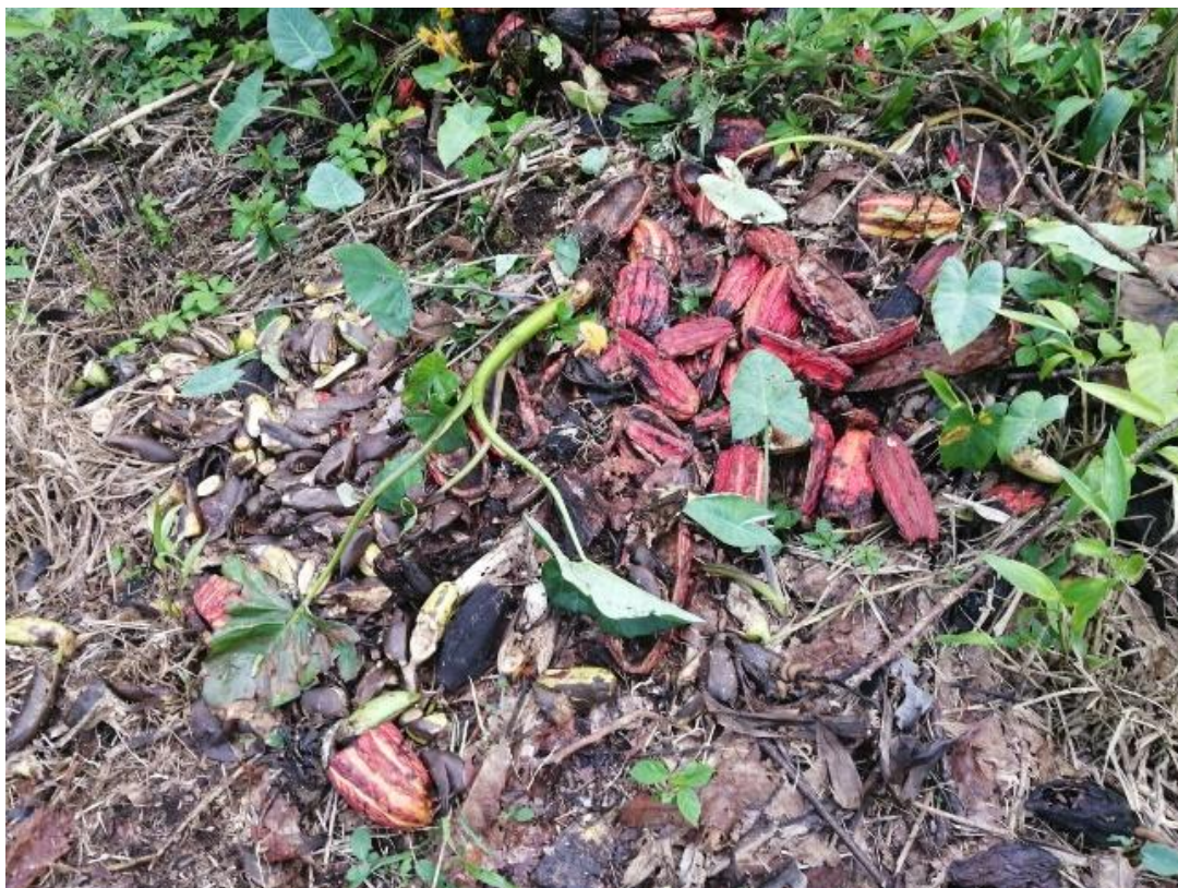
Figura 9. Los productos de la zona infestados de babosas