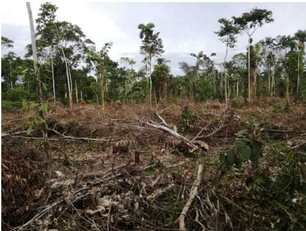
Figura 1. Área de bosque talada para sembrar la malanga