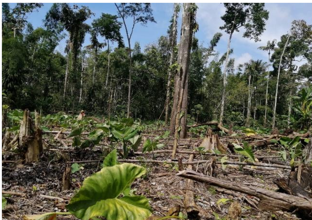
Figura 2. Sembrío de malanga