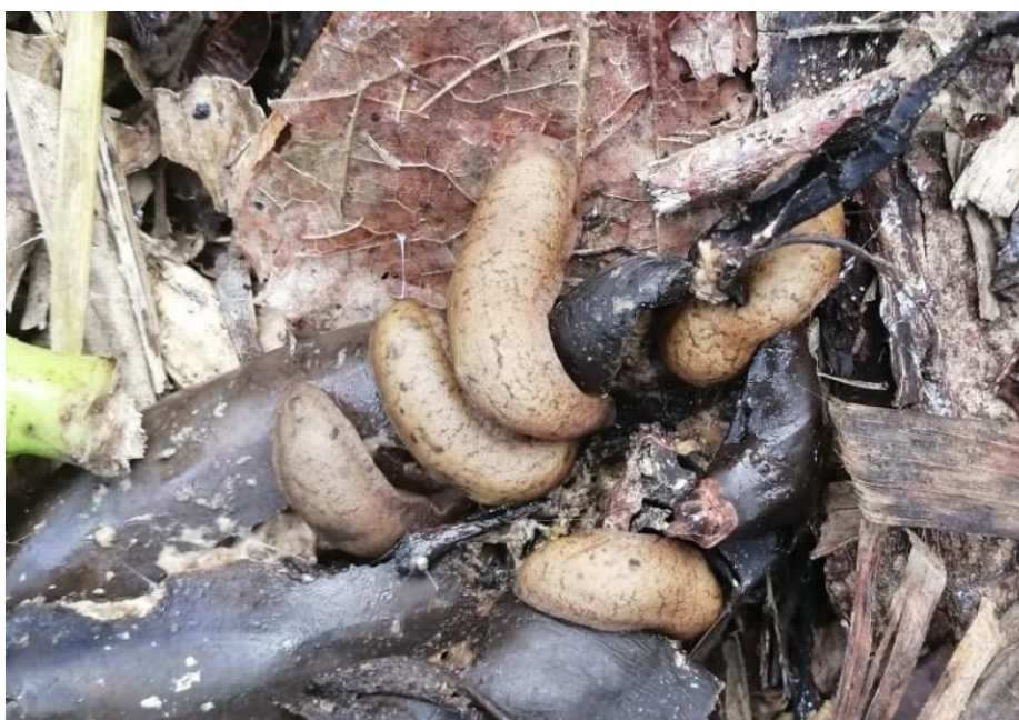
Figura 4. Las babosas consumiendo producto de la zona “Guineo”