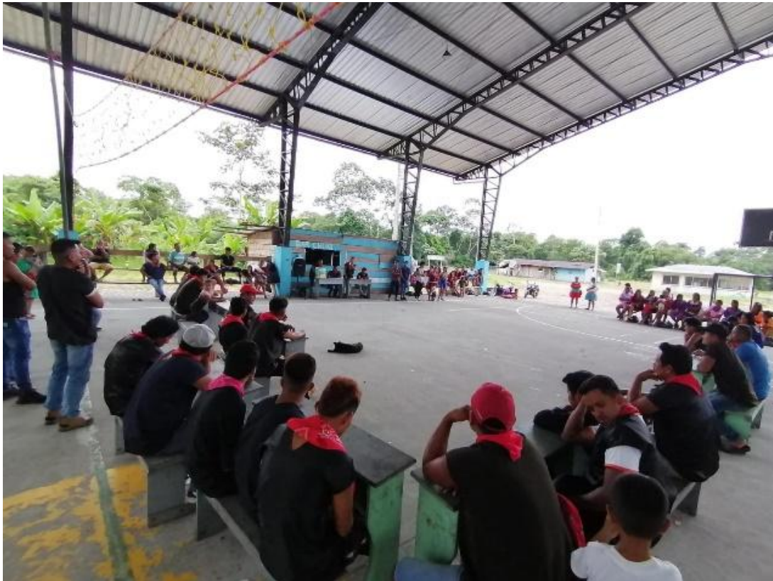
Figura 7. Comuneros en la asamblea de la comunidad A'í Kofán Duvuno