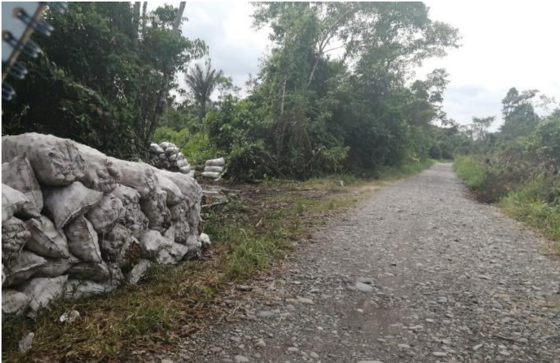
Figura 5. Sacos de malanga en la carretera para ser transportado a Centro de acopio Santo Domingo