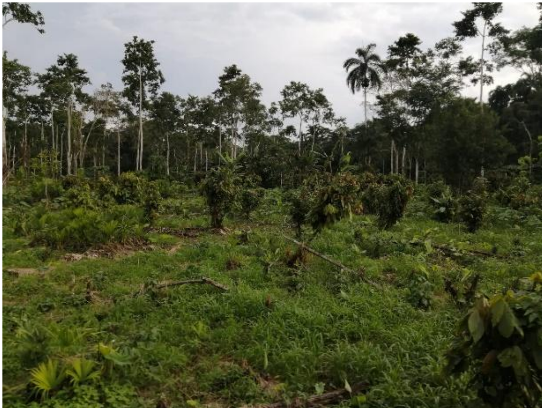
Figura 6. Área después de la cosechada de la malanga con maleza arrocillo