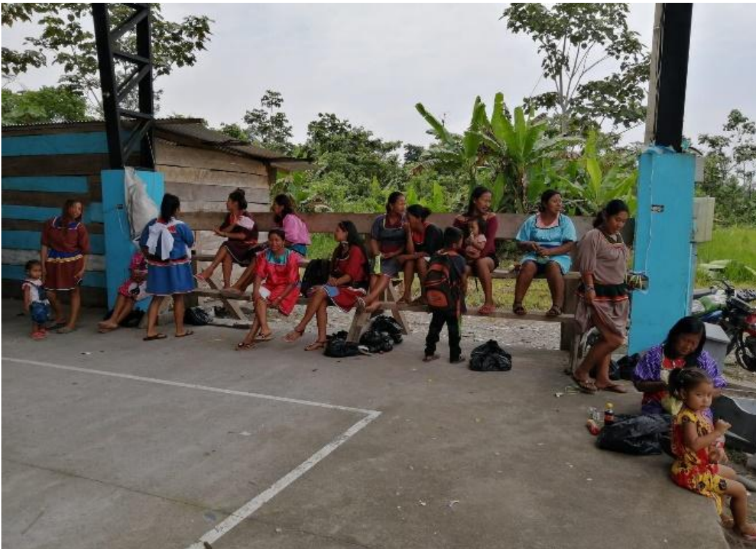
Figura 8. Comuneras en la asamblea de la comunidad A'í Kofán Duvuno