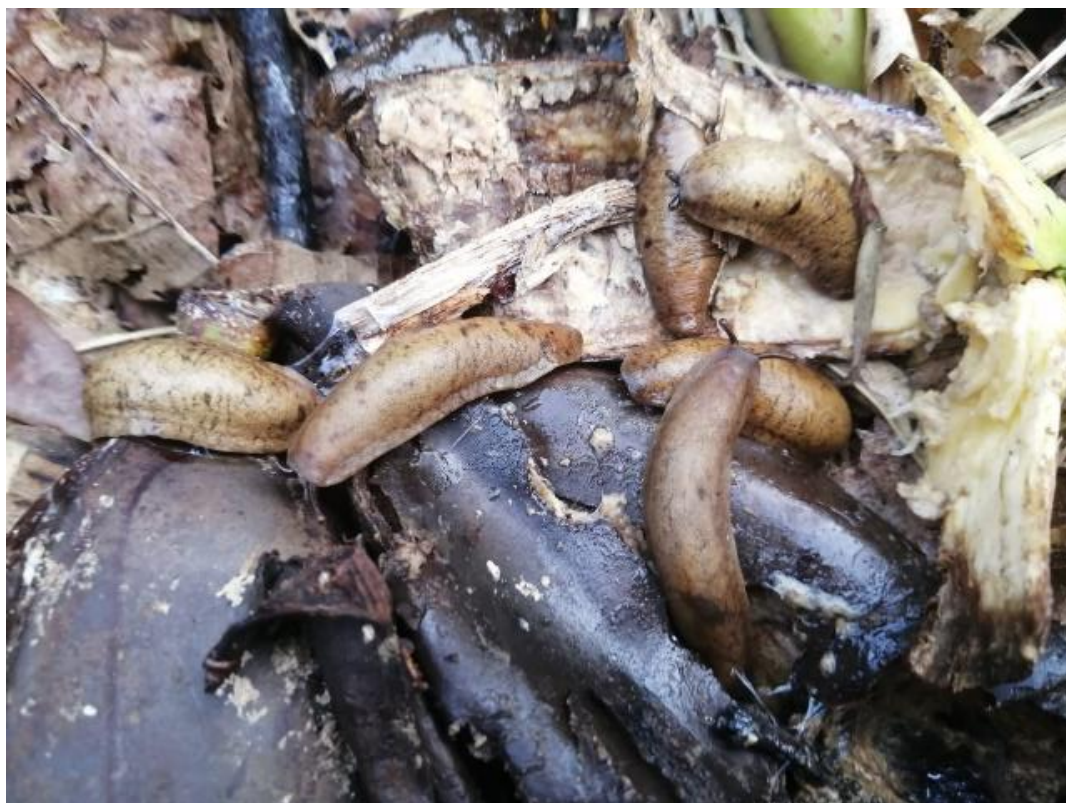
Figura 10. Las babosas consumiendo producto de la zona (guineo)