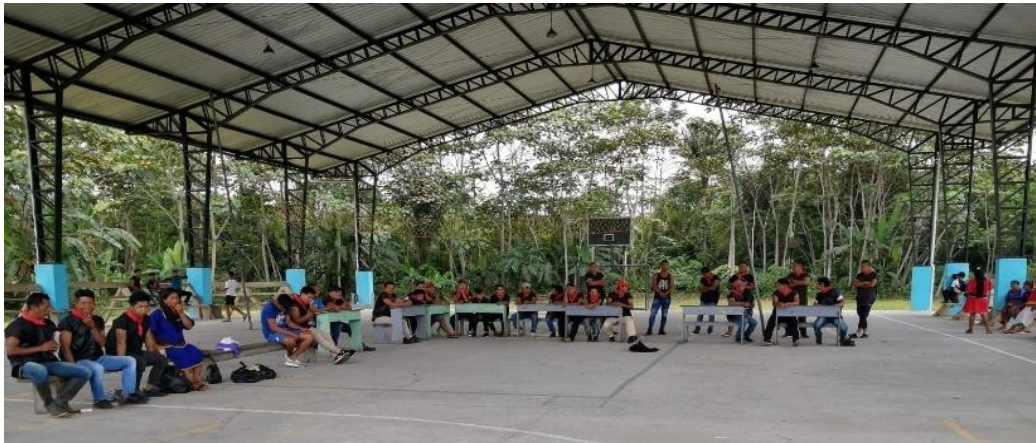
Figura 5. Comuneros en la asamblea de la comunidad

Es preocupante la pérdida de conocimientos socioculturales en la comunidad A'í Kofán Duvuno porque la mayoría de los habitantes han perdido la esencia sociocultural como A'í Kofán por la presencia y contacto permanente; y la facilidad de comunicación e interactuar con los mestizos y otras nacionalidades. Es importante buscar alternativas para evitar la pérdida de estos conocimientos y saberes ancestrales de una nacionalidad en deterioro y desaparición de sus formas de vida como A'í Kofanes.