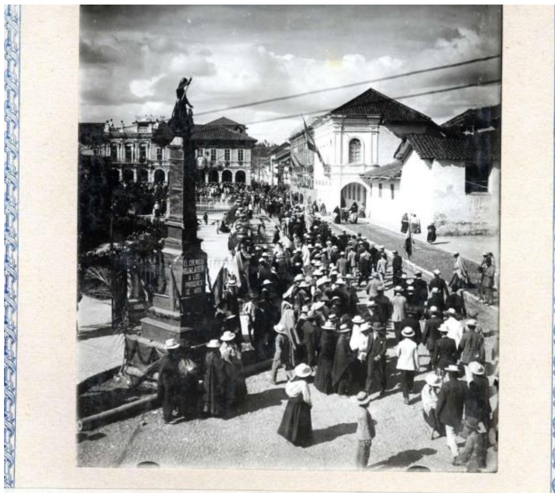
Gran desfile de los distintos gremios obreros el día 5 en las fiestas centenarias de Noviembre de 1920.

fue calificado de "magnífico, imponente", presentando a los "hijos del trabajo conscientes de sus derechos y sus deberes, en marcha triunfal". 170