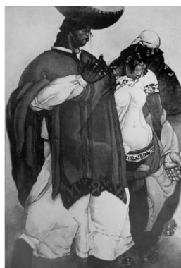
Figura 6. Camilo Egas: Raza India, 1925

colonialistas en la que los indígenas fueron observados como una alteridad cultural. 310 Estas lecturas escaparon del control del artista ya que su propósito no fue reforzar los estereotipos acerca de los indígenas, su objetivo se acercó más a reafirmar una agencia cultural dentro de los marcos modernistas. 311