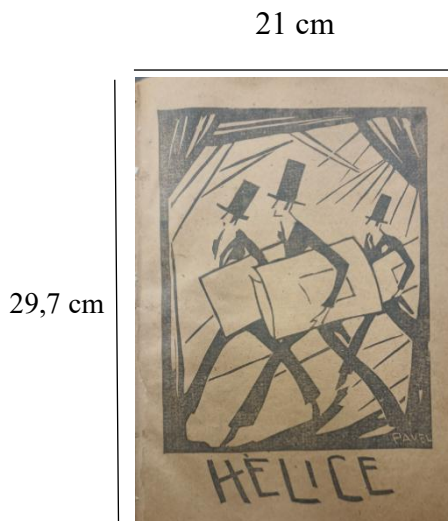
Figura 1. Portada Hélice N° 1, abril 1926

empieza en la página editorial de la revista. No todas las páginas tienen numeración. Acerca de esto, López-Ortega manifiesta que era una costumbre editorial omitir la numeración en algunas páginas, especialmente en aquellas que incluyen dibujos y caricaturas. 46 El sumario, los poemas, la narrativa, las caricaturas e ilustraciones, la publicidad y la crítica artística aparecen en todos los números. Las demás secciones no son constantes. 47 Bóveda craneana 48 y Medioambiente solo están en tres números, pero su estructura sugiere que podrían ser secciones permanentes.