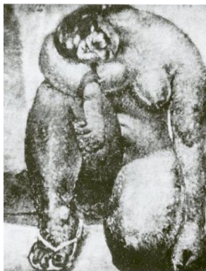
Figura 8. Camilo Egas: Desnudo (Zámbiza), 1924

En ese sentido, la construcción de lo indígena ligado a la animalidad, con gran énfasis en su corporalidad se repite por segunda vez en Hélice . La imagen y el texto se complementan puesto que, al ser percibido como una bestialidad, el indígena es retratado con deformaciones, con sus partes de cuerpo engrandecidas y una cabeza pequeña que hace referencia a ese protocéfalo. De ahí que se puede decir que la crítica se enfocó en una descripción de la obra a partir de la observación mas no en cuanto a los motivos artísticos y estéticos que menciona Pérez. El autor, al ser ecuatoriano, se encontraba atravesado por una de las concepciones nacionales acerca de los indígenas que, como ya se abordó, eran vistos como poblaciones en un estado de estancamiento y/o decadencia. Así, Prieto indica que los liberales construyeron un discurso en el que se estableció que la raza indígena estaba en una situación temporal de estancamiento. Ante ello, se habló de la necesidad de justicia y protección para lograr la igualdad que era uno de los principios de este proyecto. 326 Esto último explicaría también porque Gonzalo Escudero, el autor de la crítica, halaga a Egas como quien habla en lugar de los indígenas, ya que se trataría de una manera de darles voz y poner en evidencia su situación frente a la sociedad y el Estado.