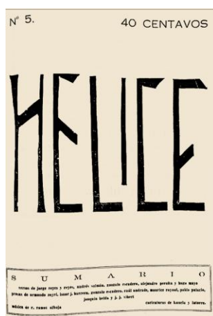
Figura 2. Portada Hélice N° 5, septiembre 1926

Está escrita a imprenta con serifas en mayúsculas y minúsculas. Los títulos están en mayúsculas y algunos subtítulos se destacan en negrita, con combinación de letras mayúsculas y minúsculas (ver figura 3). 52 Las partituras, ilustraciones y caricaturas utilizan diversos tipos de fuentes. La escritura se hace en una o dos columnas, la mayoría de ellas son rectangulares, unas cuantas tienen bordes biselados, terminan en forma triangular (ver figura 4). Los poemas están escritos en cursiva. Las fotografías, a blanco y negro, están pegadas en las hojas, no impresas. Las ilustraciones y reproducciones de grabados están impresas sobre las hojas con tonalidades de color vino, negro, negro verdusco y negro rojizo (ver figura 5). 53