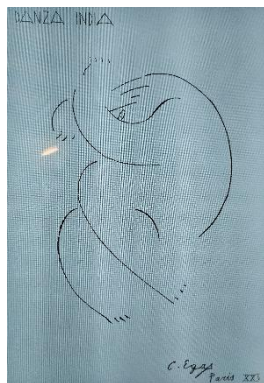
Figura 7. Camilo Egas: Danza India, 1925

Por su parte, Trinidad Pérez, encuentra similitud entre Raza India y Romeros . Ambas datan de 1925 y en ellas aparecen los indígenas con el rostro tapado o solo parcialmente visible detrás de elementos como sombreros y rondadores. Aunque no trata Danza India , la autora interpreta los rostros escondidos como recursos que Egas utilizó con la intención de dramatizar su idea de la autopercepción de los indígenas y el estado de sus mentes. 319 Es decir, aquí el artista expresa una preocupación por los indígenas contemporáneos y esto hace que la revista, una vez más, se corresponda con las ambiciones modernizadoras del Estado.