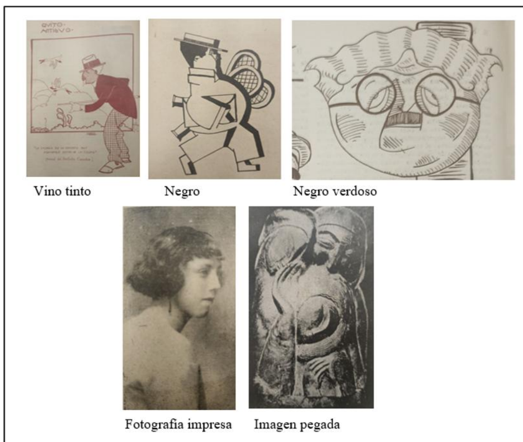
Figura 5. Colores, imágenes y fotografías de Hélice , 1926

Por otra parte, la publicación, por ser de corta duración, no cuenta con etapas. Los motivos por los cuales la revista dejó de publicarse son aún desconocidos. Se lanzaron un total de cinco números todos en 1926. El primero el 26 de abril, el segundo el 9 de mayo, el tercero el 23 de mayo, el cuarto el 4 de julio y el último el 27 de septiembre. Su costo fue de 40 centavos de sucre y la suscripción permanente tenía un costo de 2,00 sucres.