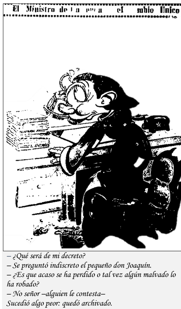
Figura 5. Caricatura en Inti

claro que la caricatura no era una simple sección, sino un espejo mordaz que reflejaba la realidad del país (ver Figura 5).