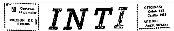
Figura 2. Característica de transición

El nombre del periódico aparecía en letras simples en la primera y la última página (del 5 al 15 de abril de 1941).