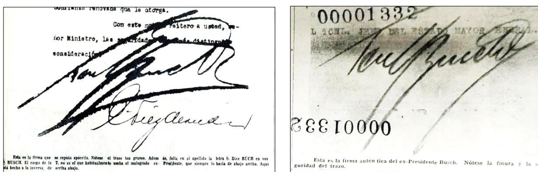
Figura 8. Falsificación de la firma del exmandatario Germán Busch

En su próximo número, Inti continuó con el tema y realizó una serie de entrevistas a autoridades, personas allegadas a Busch e inclusive se conversó con su esposa y viuda Matilde Carmona. Ellos ratificaron que el exmandatario era incapaz de sostener un acuerdo y favorecer a la Standard Oil. Corroboraron, igualmente, que la firma del documento era “apócrifa” 346 (ver Figura 8).