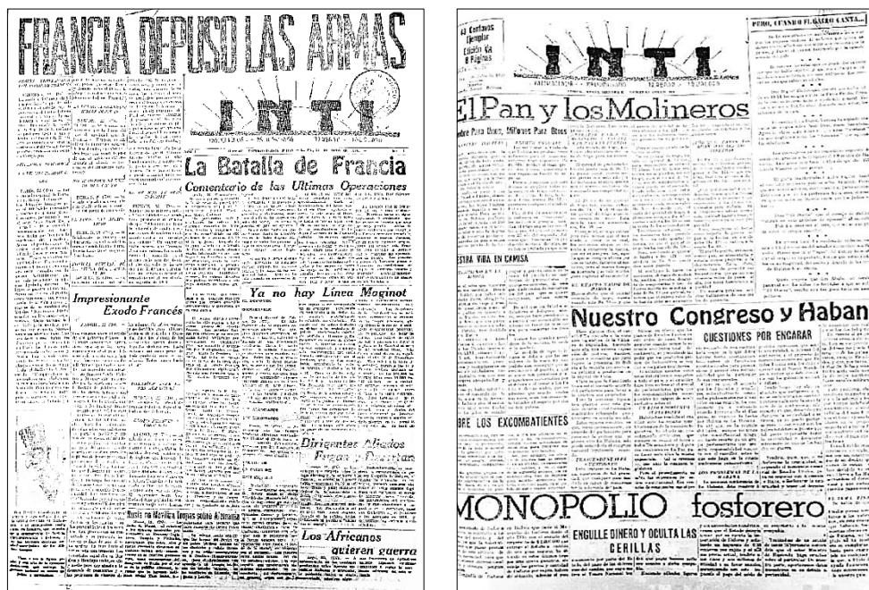
Figura 4. Cambio de lógica en las portadas de Inti A la izquierda: modelo de portada internacional. Fuente: Inti , 23 de junio de 1940: 1. A la derecha: modelo de portada nacional. Fuente: Inti , 7 de julio de 1940: 1.

Las imágenes que se exhibían en sus páginas, plasmadas en formato de dibujo, retrataban a héroes y figuras de trascendencia en la historiografía nacional. Entre ellos se distinguían a personajes como Elizardo Pérez, el “creador de la Escuela Indígena de Warisata”, 81 el “libertador” Simón Bolívar, 82 el expresidente del régimen “socialista militar”, Germán Busch 83 y Eduardo Abaroa, héroe de la guerra del Pacífico. 84 Asimismo, se rindió homenaje a personalidades que encarnaban los ideales del nacionalismo indoamericano: