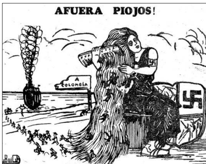
Figura 7. Representaciones de los judíos en la prensa

antiliberalismo y un anticomunismo, articulados en un desprecio hacia el “otro”; 252 en Chile, el semanario La Patria consideró que los judíos eran una “amenaza” y exigió su exclusión de la vida pública, alimentando el temor de una supuesta “invasión”; 253 en Colombia, publicaciones como El Fascista , Revista Javeriana y Anacleto avivaron el antisemitismo, incluyendo caricaturas inspiradas en la propaganda nazi (ver Figura 7). 254 En contraposición, emergieron también voces provenientes de la prensa antifascista.