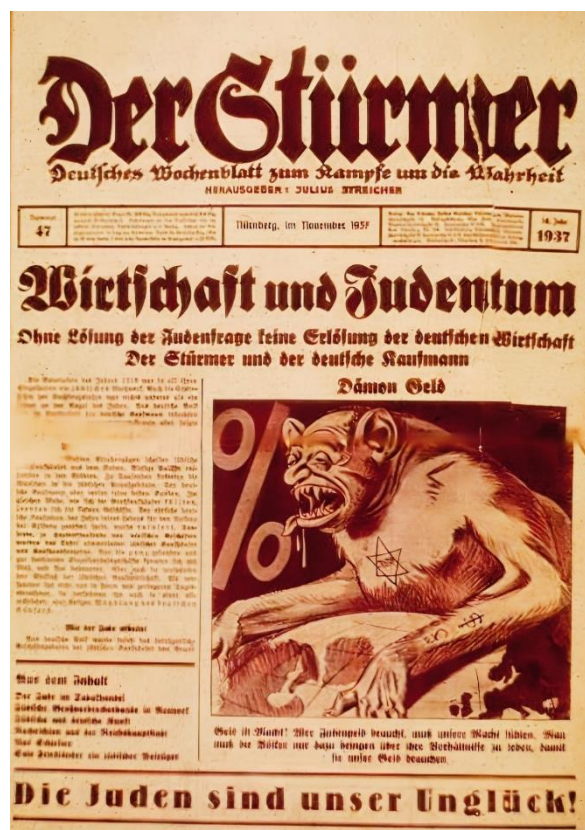
Figura 6. Ilustración del periódico Der Stürmer

Fuente: Anónimo. "La economía y el judaísmo", Der Stürmer , noviembre de 1937: 1, https://research.calvin.edu/german-propaganda-archive/sturmer.htm .