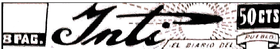
Figura 3. Cambio de logo

En una última modificación del logo, se visualiza el nombre del matutino que se alzaba en elegantes letras cursivas, acompañado por una banda que proclamaba con firmeza: “El diario del Pueblo”. De fondo, se desplegaba un sol radiante, cuyo fulgor evocaba fuerza, poder y vitalidad. El lema dotado de profundo significado expresaba la ideología política de izquierda del periódico, en la que el pueblo era considerado el principal protagonista de la construcción de la nación (ver Figura 3).