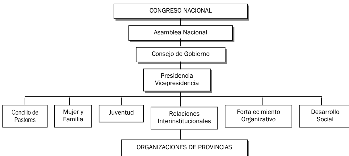
Gráfico: Estructura organizativa vigente

Los organismos rectores están constituidos por el Congreso Nacional que reúne a representantes de las organizaciones de base y provinciales cada cuatro años. Luego sigue la Asamblea Nacional compuesta por representantes legales de organizaciones provinciales y finalmente se encuentra el Consejo de Gobierno compuesto por el presidente, vicepresidente y seis secretarios elegidos para cuatro años.