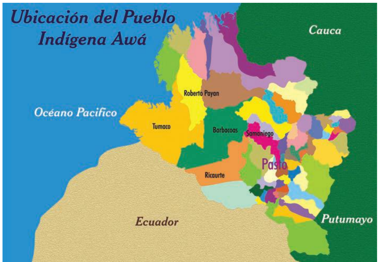
Grafico 2.