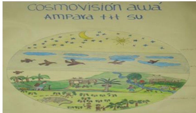
Grafico 1.