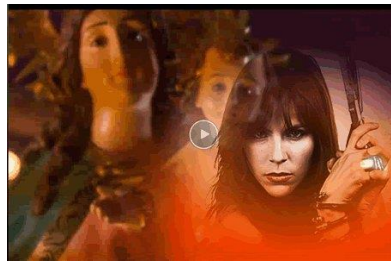
Imagen 3: fotograma de Rosario Tijeras

pero sobre todo de esa necesidad – espiritual y existencial- inherente del ser humano; que busca aproximarse a lo divino.