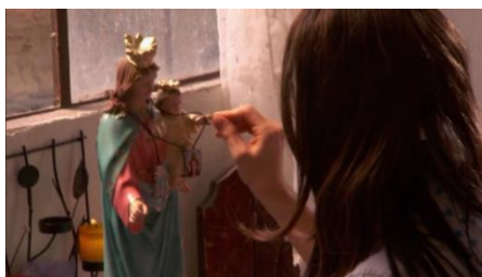
Imagen 6: Fotograma de Rosario Tijeras

Las imágenes seis y siete son parte del capítulo en el que Rosario se prepara para matar a un coronel de la policía, el riesgo que implica esta misión hace que ella haga un ritual más largo, en el que por un descuido la imagen de la Virgen cae al suelo y se rompe; esto es tomado como una señal de mala suerte, que más tarde se confirma cuando Rosario es herida en el atentado.