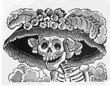
Imagen 2: La Garbancera de José Guadalupe Posada

La obra de Posada es una patente perpetua en el imaginario popular de los mexicanos. [...] La Catrina o La Calaca evoca el sincretismo entre Tonantzin, la deidad de los antiguos mexicanos, y la virgen María, madre del hijo del Creador del universo en la religión católica. La Santa Muerte, esqueleto vestido con el color con el que se invoca el favor, es la madre de todos los desprotegidos. Es la única madrecita que vela por ellos, que les promete el sueño eterno cuando llegue la hora, que los acompaña en la vida y en la muerte. La Calaca es la única en la que se puede confiar, encarna la verdadera y única democracia. 57