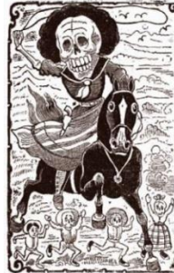
Imagen 1: La Adelita, grabado de José Guadalupe Posada.