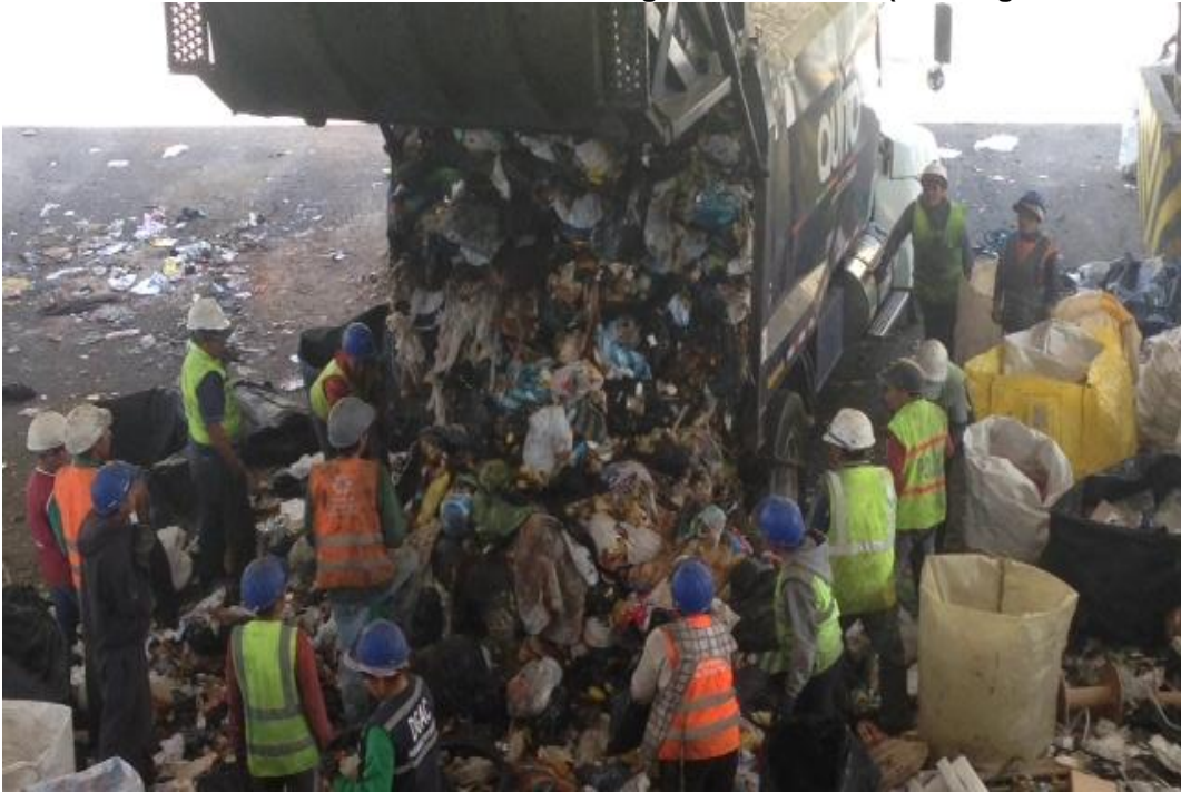
Fotografías n° 3 y 4 Estación de Transferencia Norte- descarga de recolector. (10 de agosto de 2016)