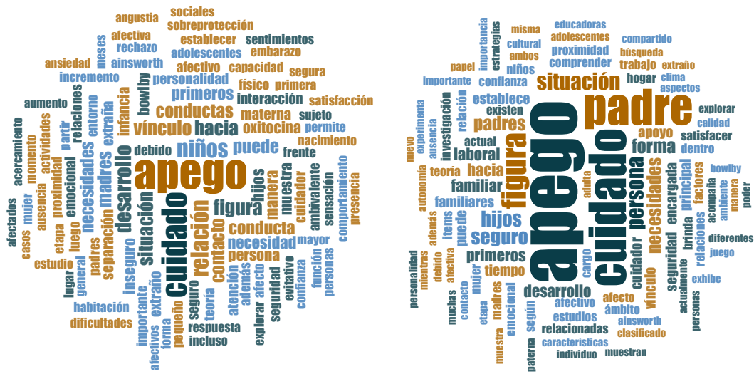
Gráfico 9: Discursos de género: Normativo (derecha), Crítico (izquierda). (Elaboración: Glenda Villamarín)

madre y sus responsabilidades, las relaciones de poder se encuentran naturalizadas al punto de ser invisibles. Los dos tipos de discurso son contrastados en el gráfico 9.