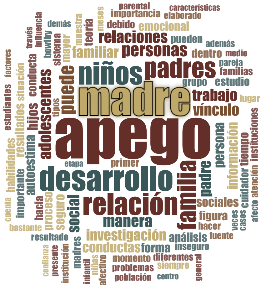
Gráfico 1: Nube de palabras del total de los documentos (Elaboración: Glenda Villamarín)

El gráfico 1 muestra también que a medida que nos alejamos del núcleo central de la teoría entran en juego palabras de uso más común, y que esperaríamos que aparezcan en relación con casi cualquier tema que entre en el campo de la psicología. Este fenómeno refleja la heterogeneidad interna al conjunto de casos estudiados. De hecho, los casos están compuestos por documentos que pueden ser clasificados en dos grandes categorías: temática (rangos etarios), y según el enfoque de pensamiento psicológico y/o psicoterapéutico. Los temas abordados, por los documentos (25 muestra total), de quienes hacen Teoría del Apego en Ecuador se organizan en función de las especializaciones comunes en el medio, a saber: psicología infantil (9 casos), psicología de la adolescencia (7 casos), y psicología de los adultos (6); únicamente en tres casos encontramos un tratamiento general o de múltiples temáticas. En cuanto a la concentración de fenómenos investigados, encontramos sicopatologías variadas (5), temas generales de psicología (5), psicología educativa (4). Las escuelas estándar de la psicología también constituyen una fuente de variación: psicoanalítica (3 casos), teoría sistémica (2 casos), Teoría del Apego