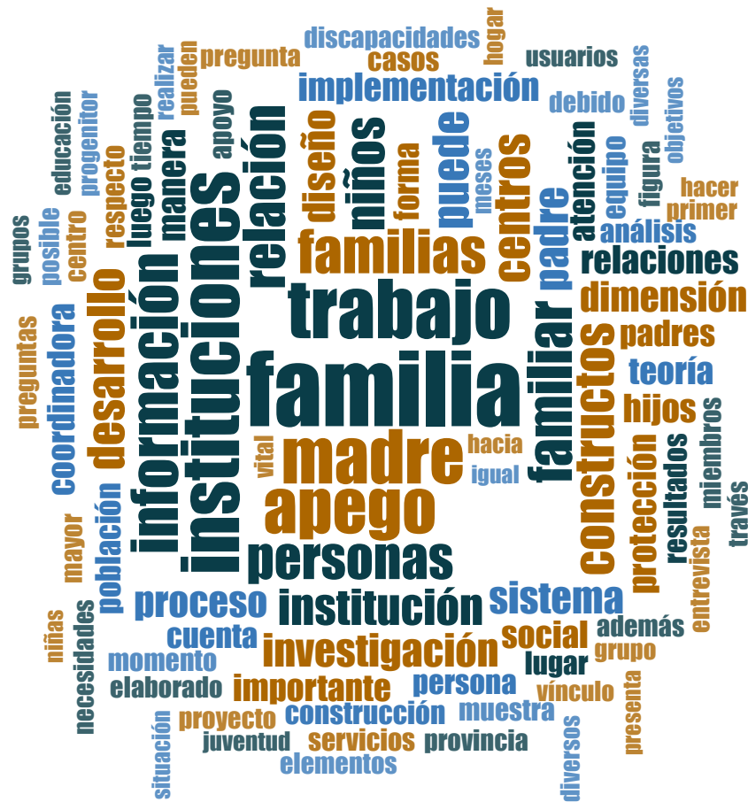
Gráfico 6: Discursos amplios. (Elaboración: Glenda Villamarín)

Como habíamos anticipado, esperaríamos que el enfoque usado por los investigadores sea una fuente de variabilidad respecto del patrón general de recepción/práctica de la Teoría del Apego. La evidencia disponible indica que en aquellos estudios que tratan de trastornos psicológicos específicos (psicopatología) ponen énfasis en aspectos instrumentales o de medición del apego seguro, en la importancia de la familia nuclear, y se resta importancia a los estilos de crianza. Al mismo tiempo, estos estudios usan con mayor frecuencia la noción de cultura, y prestan una mayor atención reflexiva a la variabilidad cultural. Los tratamientos generalistas o eclécticos destacan por ser aún más normativos que el consenso imperante. Así también, los estudios desde la psicología educativa resultan particularmente normativos, en especial cuando se refieren a la crianza y al rol materno.