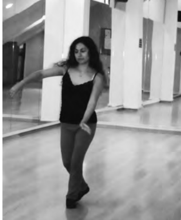
Imagen 2 BITÁCORA TESTIMONIAL DE L. U.