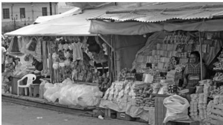
Figura 7: Puestos de artesanías en los alrededores del atrio.