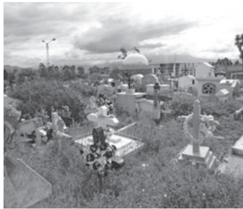
Figura 4: Lápidas en el cementerio de la parroquia de El Quinche.

ba detrás de la imagen de bulto de la Virgen. (Terán, 2001, p. 58)