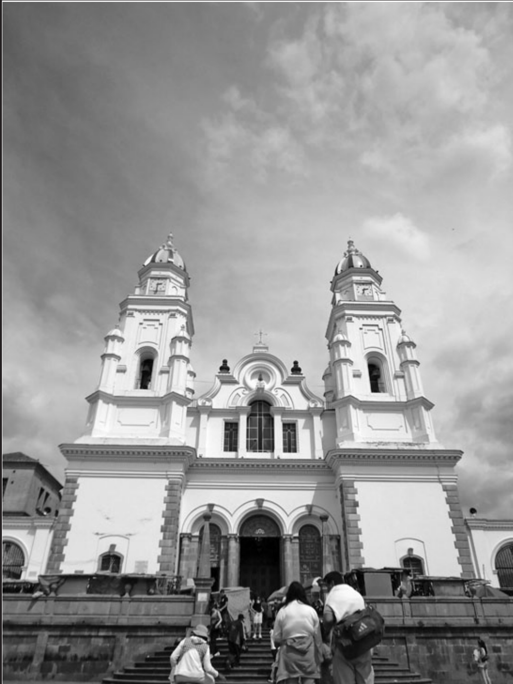
Portada del santuario de la Virgen de El Quinche, Quito.