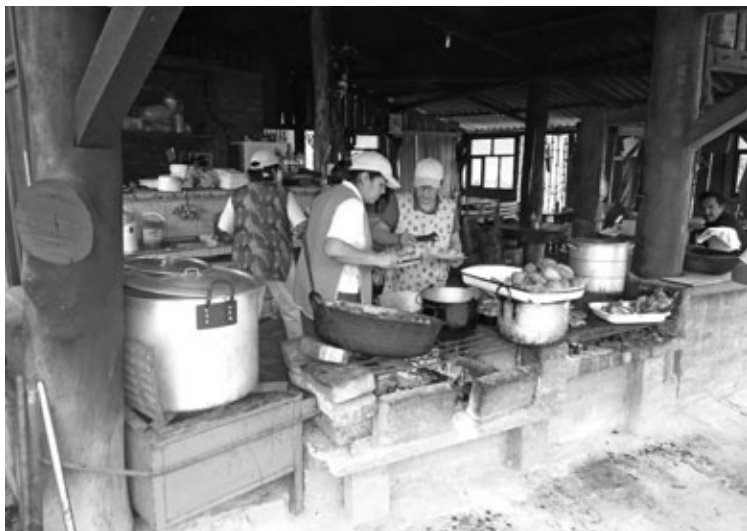
Figura 2: Paradero de comida popular en las afueras de El Quinche.

De acuerdo con esta caracterización, lo inmaterial incluiría todos aquellos aspectos que significan dentro de la vida humana y la dotan de sentido. Pero ¿todas aquellas manifestaciones son susceptibles de patrimonialización, es decir, susceptibles de un registro de carácter burocrático por parte de las instancias gestoras de la cultura: UNESCO, institutos de patrimonio cultural, gobiernos seccionales, municipios...? ¿O solamente las más representativas?