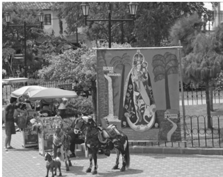
Figura 1: Estudio fotográfico callejero para conmemorar la visita al santuario. Lienzo con representación de la Virgen y caballo para posar.