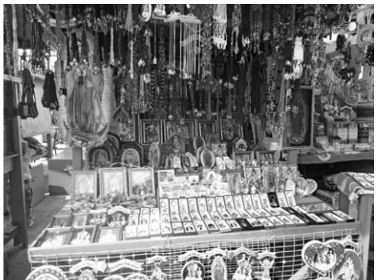
Figura 6: Puestos de artículos religiosos en las inmediaciones del santuario.

[...] si los santuarios son un marco general en el que se dan fenómenos diversos pero encadenados e imbricados entre sí, únicamente el análisis global de este marco nos permitirá captar con una cierta fiabilidad los diversos aspectos que en él confluyen, y quizá lo que es más importante, valorar en su justo término las funciones sociales, políticas y simbólicas que aquéllos cumplen. (2003, p. 215)