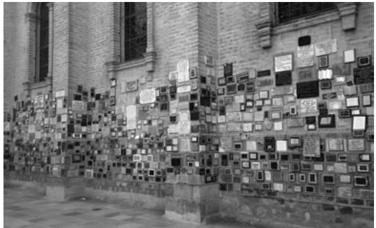
Figura 5: Exvotos en las paredes exteriores del santuario.

Así expresado, el registro ofreció un escenario segmentado en diversas manifestaciones –o ítems– de una totalidad significativa llamada santuario. Estas tipologías, si bien proveyeron datos sobre el “estado de conservación” y los “factores