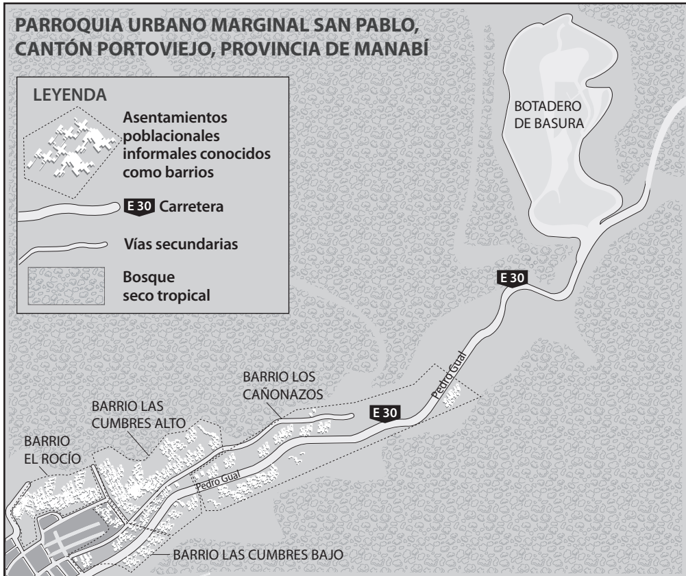
Mapa 3. Afecciones en el barrio Los Cañonazos