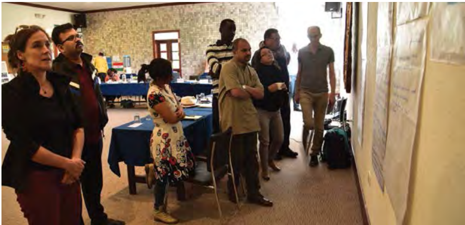
Miembros del Grupo de Trabajo Global durante la reunión interna en Puenbo, Ecuador.

Dentro de nuestro grupo, coexistieron diversas posiciones sobre cómo combinar estas estrategias de corto y largo plazo orientadas al Estado, así como sobre la probabilidad y las dificultades relacionadas con la construcción de una forma verdaderamente alternativa de organizar la sociedad. Sin embargo, estuvimos de acuerdo en que este debería ser uno de los debates centrales para la reinención de la política de izquierda, como veremos en la siguiente sección.