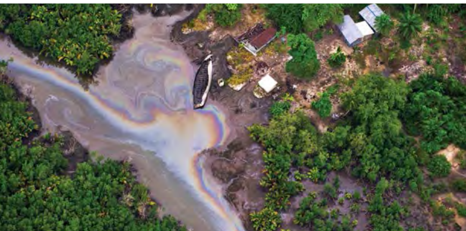
Imagen aérea del Delta del Níger contaminado.

A medida que la lucha Ogoni se extendió por toda la región, las comunidades Ijaw también comenzaron a organizarse y obstaculizar las actividades de explotación petrolera.