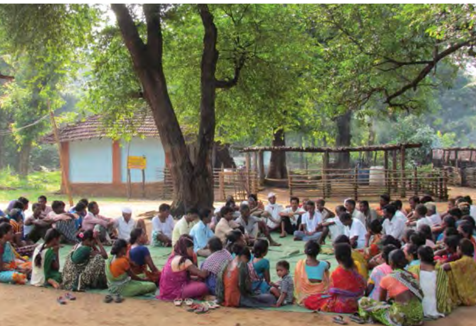
Gram sabha , Mendha.

Con el aporte de estos principios básicos, los círculos de estudio comenzaron a explorar los conceptos de desarrollo y gobernanza. Los debates comenzaron a explorar preguntas como ¿qué es el Gobierno? ¿Qué es Desarrollo? ¿El desarrollo es la construcción de carreteras, escuelas y hospitales? ¿Quién debería llevar a cabo el desarrollo y para quién? Los pobladores sabían que, en el esquema actual, todas las decisiones las tomaba el gobierno, incluso sobre el desarrollo de los pueblos y el uso y control de los recursos. Todos esperaban que el gobierno hiciera lo correcto, pero nadie en el pueblo sabía quién o qué era el gobierno. La experiencia colectiva de las personas demostró que el gobierno hizo poco por el bienestar de la gente. Sus experiencias con funcionarios del gobierno habían sido modeladas en gran medida por la opresión, la extorsión y los sobornos. Los pueblos comenzaron a preguntarse por qué deberían esperar a que el gobierno los “desarrollara”. ¿Por qué ellos mismos no podían definir cuáles eran sus necesidades y abordarlas?