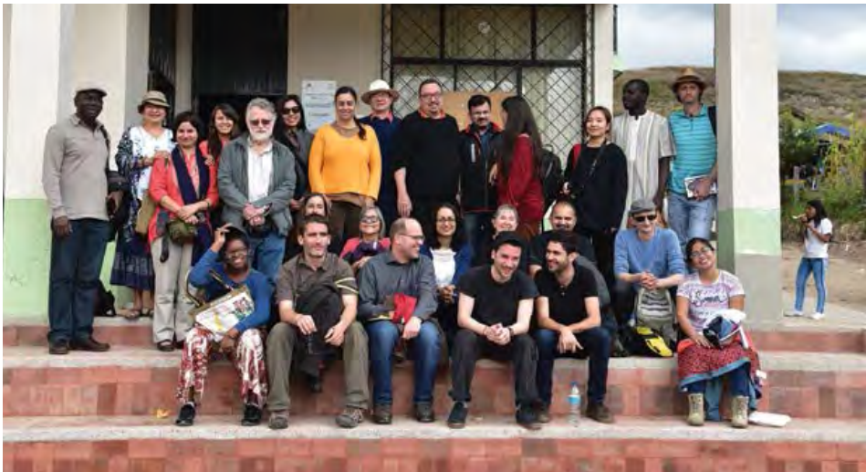
El Grupo de Trabajo Global durante la excursión en Nabón, mayo de 2017.

Antes de describir las cuatro secciones sobre cada uno de estos temas, hemos dedicado una sección a las particularidades e integraciones de nuestros diálogos, y las formas en que nos relacionamos con los legados y presentes coloniales, así como con el patriarcado y el género.