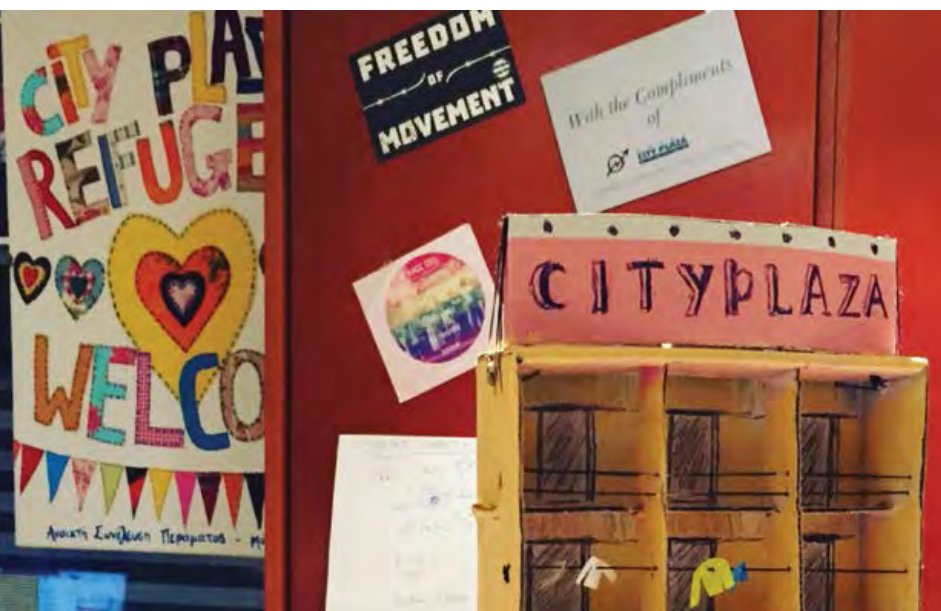
Casa okupa City Plaza, Atenas.

los refugiados; la legalización plena de todos los refugiados; que no haya deportaciones a Turquía ni a ningún otro lugar; la provisión de viviendas dignas y condiciones de vida para todos los refugiados dentro de las ciudades; el cierre de todos los centros de detención y campamentos; el acceso gratuito a servicios de salud y educación para inmigrantes.