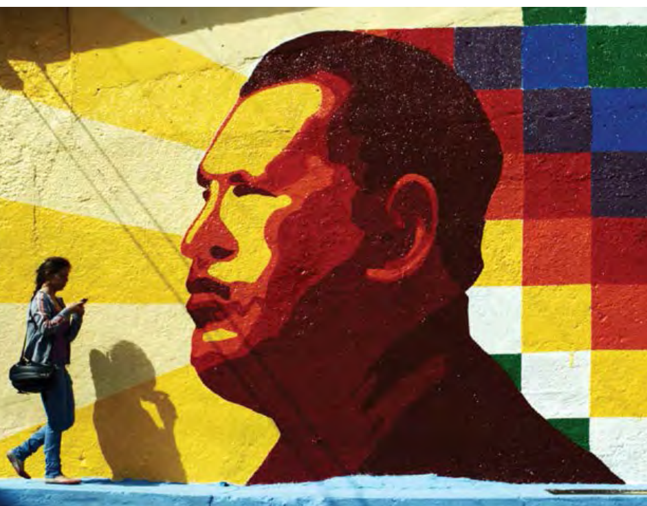
Mural de Chávez.

Un ejemplo reciente de esta fusión entre el ámbito político/partidista (que representa a una parte de la sociedad) y lo público/estatal (que se supone que representa a toda la sociedad) han sido los Comités Locales de Abastecimiento y Producción (CLAP), creados como mecanismo para distribuir bienes básicos (especialmente alimentos) cuando prevalece una grave escasez. Aunque se trata de un programa público, financiado con recursos estatales, se compone principalmente de estructuras del PSUV, como las Unidades de Batalla Bolívar-Chávez (UBCH) y el Frente Francisco de Miranda (Ministerio del Poder Popular para la Mujer y la Igualdad de Género,