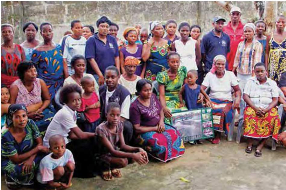
Reunión pública del PNUMA en Ogoniland.

Si bien se organizaban mítines en el Día Ogoni anual y en otras ocasiones simbólicas, el MOSOP se volvió cada vez más dependiente de los donantes occidentales para financiar proyectos específicos. Tras los llamamientos del MOSOP, el segundo gobierno federal post-militar en 2007 invitó al Programa de las Naciones Unidas para el Medio Ambiente (PNUMA) a llevar a cabo una evaluación de los sitios contaminados en Ogoniland. El informe posterior del PNUMA, publicado en 2011, reveló que la contaminación “ha penetrado más y más profundo de lo que muchos suponían” (PNUMA, 2011). El PNUMA descubrió que las fuentes de agua de la comunidad ogoni estaban contaminadas con benceno cancerígeno, con niveles 900 veces superiores a lo establecido en las directrices de la Organización Mundial de la Salud. El llamado del PNUMA a la limpieza inmediata de los sitios contaminados se ha recibido con respuestas lentas por parte del gobierno federal y de Shell.