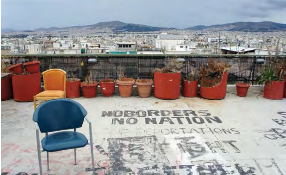
Espacio solidario en el City Plaza, Atenas.

Este es un importante precedente internacionalista, no solo porque resaltó el hecho de que el tema de los refugiados no está separado de otras formas de opresión y disciplina que afectan a la gente, sino también porque puede servir como punto de referencia para una red sistemática de movimientos sociales europeos. Además, también constituye un intento de formar una respuesta social ante el aumento de la violencia, los partidos y la política estatal contra los refugiados.