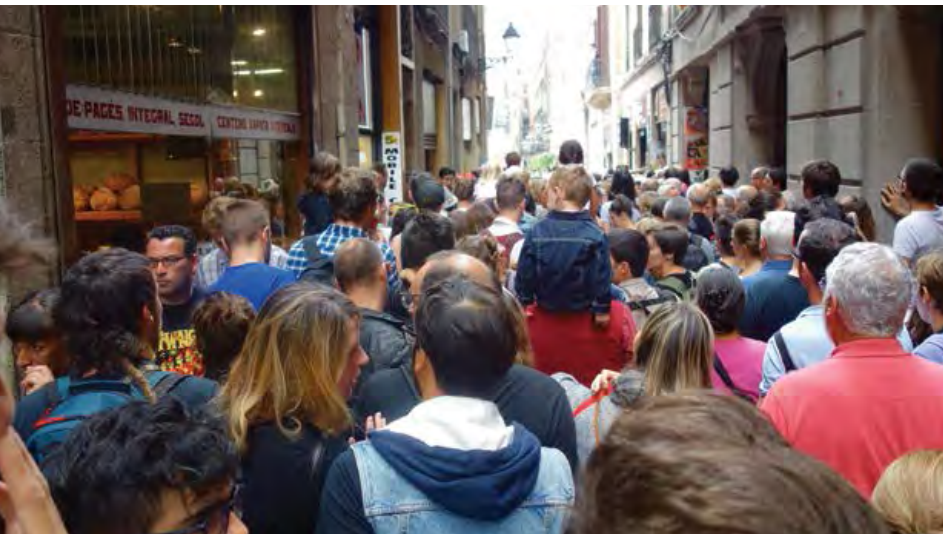
Turistas, Plaça de Sant Jaume, Barcelona.

Sin embargo, ha resultado muy difícil cerrar los alojamientos turísticos irregulares, y este verano se espera que las cifras de turistas alcancen un nuevo récord.