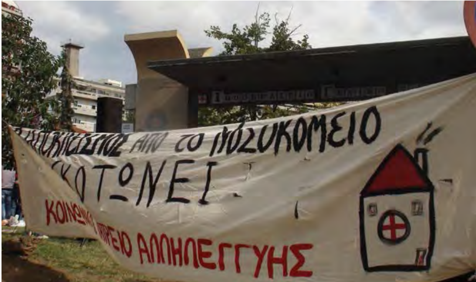
Clínica de Solidaridad Social, Tesalónica.

se redujo en un 56%, de 5,1 mil millones de euros en 2009 a 2,2 mil millones en 2012, hecho que llevó a un aumento de hasta el 70% en las contribuciones de pago por medicamentos para pacientes cubiertos por la seguridad social (Solidarity4All, 2014).