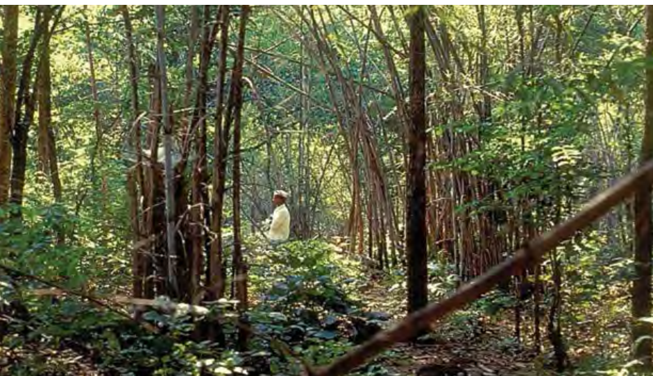
Extensiones de bambú que Mendha cosechaba bajo el JFM.

derechos CFR, los Departamentos Forestales deben otorgarle a la gram sabha el derecho de emitir pases de tránsito para bambú.