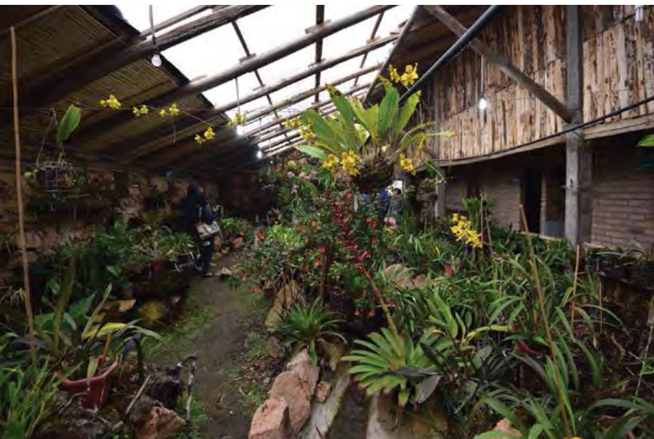
Jardín municipal de orquídeas con más de 80 variedades de orquídeas, Nabón.