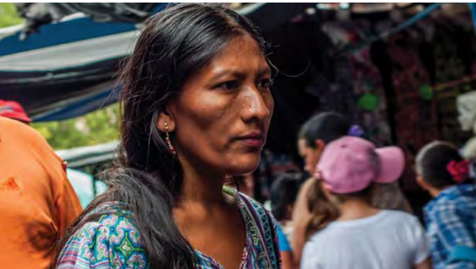
Mujer indígena de la comunidad Wayuu.

Es la misma situación con respecto al derecho de los pueblos indígenas a aplicar sus propias normas de justicia: “Las autoridades legítimas de los pueblos indígenas en su hábitat podrán aplicar instancias de justicia basadas en sus tradiciones ancestrales y que solo afecten a sus integrantes...” (Artículo 260). Si no hay territorios reconocidos como territorios indígenas, no existe un lugar en el que pueda ejercerse este derecho a aplicar sus propias tradiciones jurídicas y sus propios estándares de justicia. Sin demarcación territorial, los derechos de los pueblos indígenas garantizados en la Constitución quedan vaciados de todo contenido.