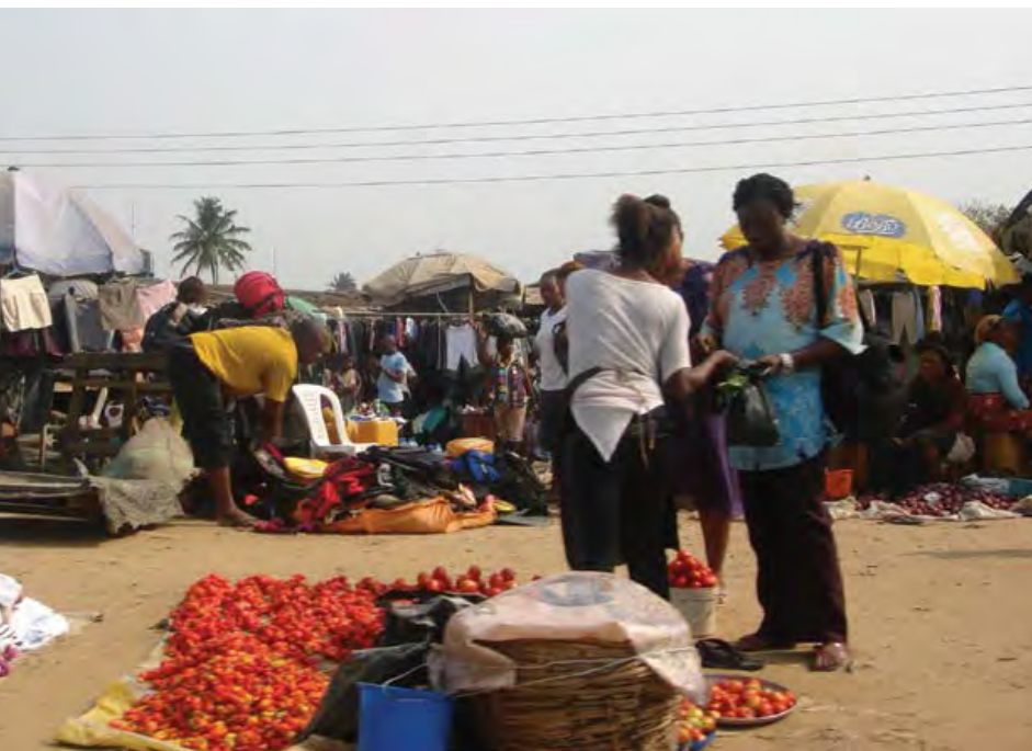
Mujeres en el mercado, estado de Río de Janeiro.

El territorio Ogoni ha sido trazado en el estado de Río de Janeiro, y los pueblos Ogoni se han distribuido en tres áreas de gobierno local. Las comunidades Ijaw, por el contrario, se extienden en seis estados (Akwa Ibom, Bayelsa, Delta, Edo, Ondo y Río de Janeiro) y cerca de dos docenas de áreas de gobierno local.