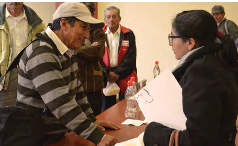
La alcaldesa Magali Quezada hablando con un ciudadano de Nabón.

El nuevo sistema participativo de toma de decisiones se basó en el reconocimiento de la cosmovisión andina y de las formas indígenas de organización social, con un fuerte énfasis en la asamblea general como el ente supremo de toma de decisiones, pero también en los principios de complementariedad, reciprocidad, solidaridad y trabajo comunitario no remunerado (minga). Este reconocimiento oficial de las formas indígenas de hacer las cosas por parte de las autoridades locales fue un primer paso crucial para transformar las tensas relaciones interétnicas que habían caracterizado al cantón hacia una convivencia intercultural próspera donde actualmente las voces indígenas tienen el mismo peso que las mestizas. En Nabón, en lugar de despreciar a lo indígena y considerar inferior todo lo relacionado con ello, el nuevo sistema lo considera una fuente de inspiración y un modelo que debería implementarse en todo el territorio del cantón, incluso en las zonas donde vive una mayoría mestiza.