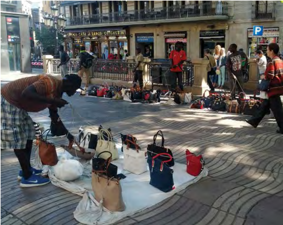
Vendedores ambulantes, Barcelona.

legal, en mercados y ferias. Pero el gobierno también reconoce que “obviamente, Diom-Coop no resolverá un problema tan complejo como la venta ambulante sin licencia”, como dijo la alcaldesa Colau en una publicación de Facebook (Colau, 2017). Es una realidad que se ha convertido en un gran problema político.