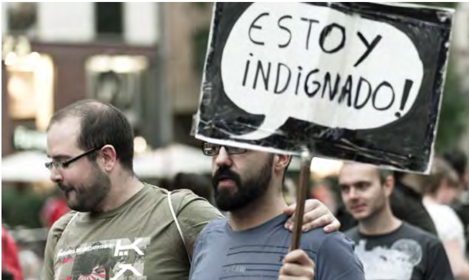
Protesta del 15M, 201.

Algunos han llamado a esto una “esfera pública postmediática” más allá de los medios de comunicación tradicionales, una esfera en la que circularon los llamados a la movilización, donde se compartían eslóganes, y donde los activistas sondeaban el clima general y sus propuestas políticas. (Toret, 2013). El creciente uso de las redes sociales llegó a desplazar los proyectos más políticos y experimentales que habían surgido anteriormente, como la Web 2.0 (con Indy-media como el ejemplo principal) o la blogósfera.