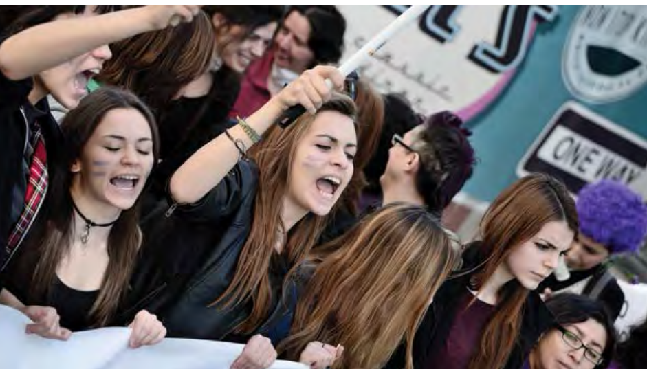
Manifestación para reclamar la igualdad de derechos para las mujeres, 2015.

institucional y participación pública; segundo, un compromiso con las políticas públicas que desafíen los roles de género y busquen romper el patriarcado; y tercero, una forma diferente de hacer política, basada en valores y prácticas que pongan énfasis en la vida cotidiana, las relaciones, el papel de la comunidad y el bien común. (Galcerán y Carmona, 2017). Lo último implica el desarrollo de políticas públicas feministas en todas las áreas, y la introducción de ideas como la diversidad, la corresponsabilidad, la cooperación y la no competencia, así como el cuidado, todo lo cual tiene un profundo impacto en las concepciones clásicas del poder.