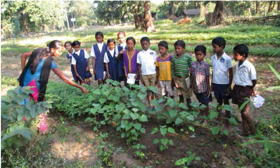
Guardería de Mendha-Lekha.

El segundo paso importante ha sido el establecimiento de un sistema de préstamo del pueblo. La población tribal y que depende de los bosques en toda la India es explotada ya que a menudo la gente se ve obligada a recurrir a prestamistas en tiempos de escasez. Estas personas a menudo entran en un ciclo interminable de explotación, con tasas de interés cada vez mayores. En algunos casos, los hijos terminan atados a los prestamistas por los préstamos que adquirieron sus padres. Para evitar tal explotación, la gram sabha de Mendha ofrece un préstamo financiero a cualquiera que necesite dinero. Durante el primer año no se cobran intereses; en el segundo año se cobra una tasa de interés del 2%, y durante un período de tiempo la tasa de interés aumenta nominalmente. El grupo de autoayuda del que forman parte los pueblos asegura que se ofrezca dicho préstamo en tiempos de necesidad y también garantiza que los préstamos se devuelvan a su debido tiempo.