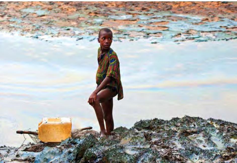
Niño parado en la orilla de un río contaminado por petróleo de Shell, Ogoniland.