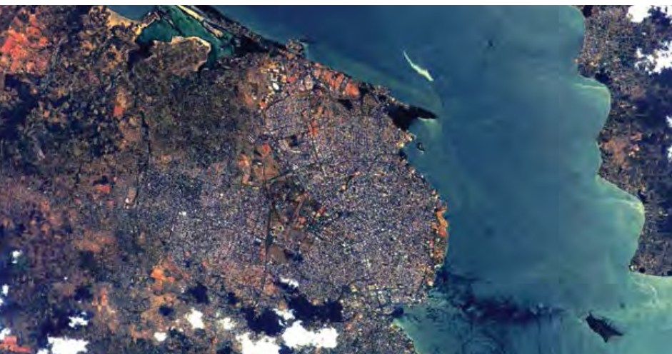
Derrame de petróleo, Venezuela.

Este es un territorio habitado por varios pueblos indígenas, un territorio que forma parte de la selva amazónica que desempeña un papel vital en la regulación de los regímenes climáticos del planeta, un área de extraordinaria biodiversidad, y contiene las principales fuentes hídricas de Venezuela. Las represas hidroeléctricas que suministran el 70% de la electricidad consumida en el país se encuentran dentro de los límites del Arco Minero. Todo esto se ve amenazado por los proyectos de explotación minera a cielo abierto a gran escala contemplados para esta área. Esta decisión, en la que está en juego el futuro del país, fue tomada por el presidente de la República, en ausencia total de debate público, sin consultar a la Asamblea Nacional, y en violación tanto de la Constitución como de varias leyes concernientes a los derechos de los pueblos indígenas, así como los derechos ambientales y laborales.