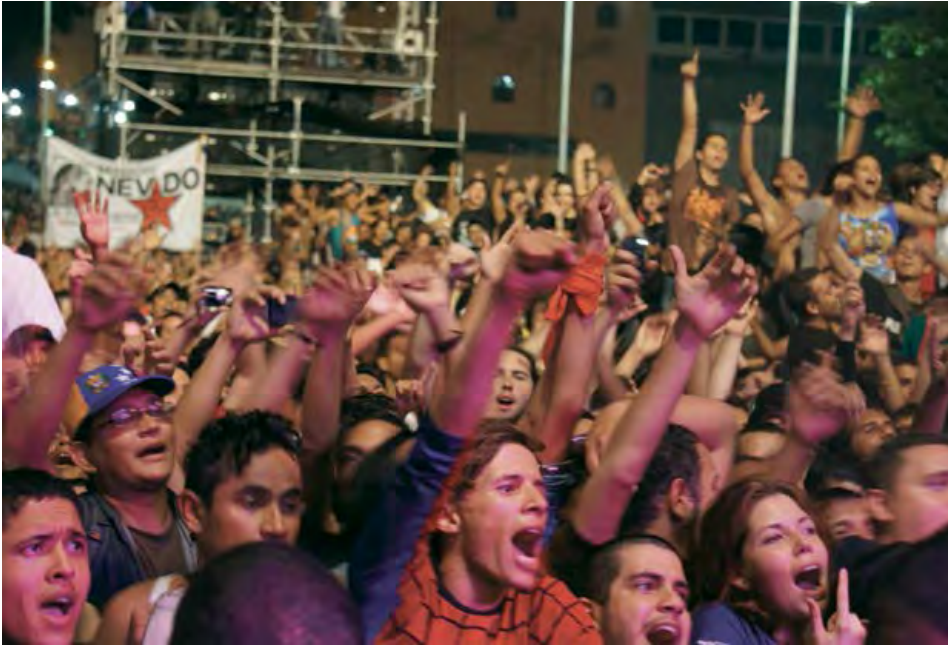
Abril de 2013, plaza Diego Ibarra.

revocatorio presidencial. Chávez salió de ese referéndum con mayor legitimidad. Fue ratificado en el cargo con el apoyo del 59,1% de los votantes. En enero de 2005 se produjo un hito de consecuencias extraordinarias cuando, en el Foro Social Mundial de Porto Alegre, Chávez declaró que el proceso bolivariano era socialista. 7