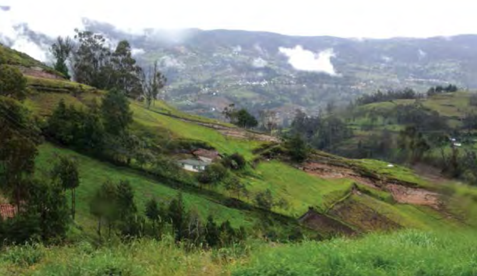
Fertilidad del suelo restaurada.