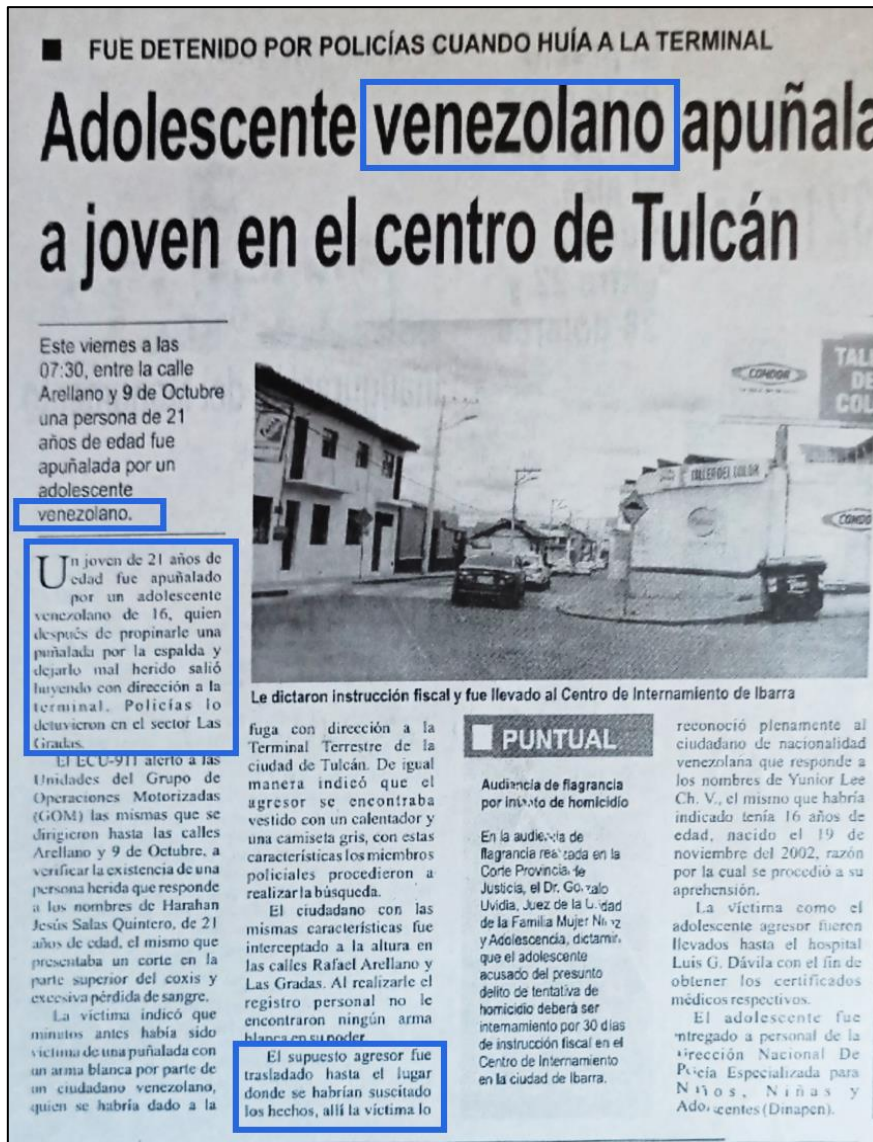
Figura 2. Nota 1 Diario La Nación

Algo similar se observa en la nota del Domingo/Lunes 27/28 de enero del 2019 “Mas de 2000 venezolanos dejan la terminal de Tulcán”, de manera reiterativa se hace referencia a la nacionalidad de las personas. A pesar de que el antetítulo menciona el temor y pánico xenofóbico no se desarrolla este tema, ni se presenta información relacionada a la manera en que esto se manifiesta o se percibe por parte de la población. En este caso cobra mayor relevancia el delito cometido por una persona como la principal causa, se continúa perpetuando la idea de que tener una determinada ciudadanía va de la mano del cometimiento de crímenes.