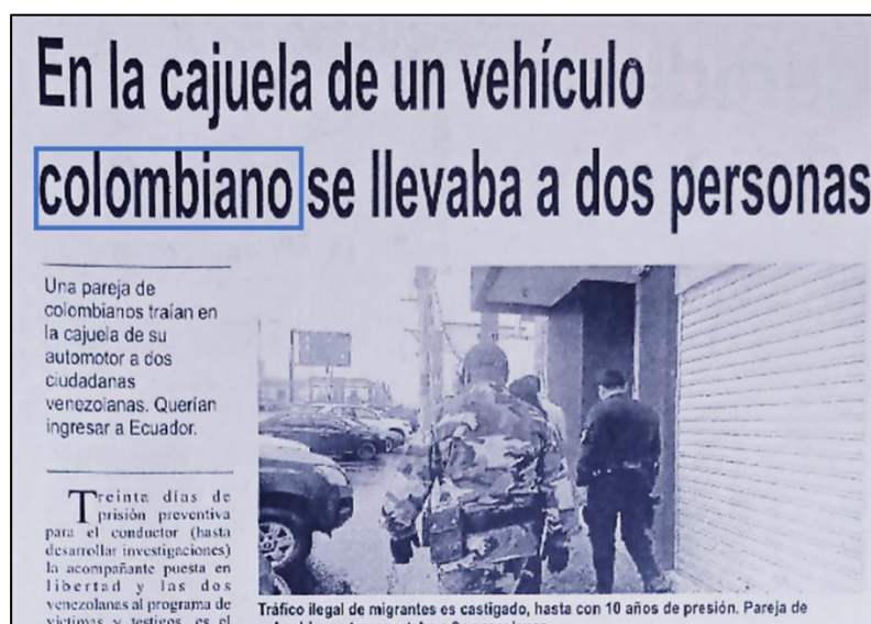
Figura 7. Nota 6 Diario La Nación.