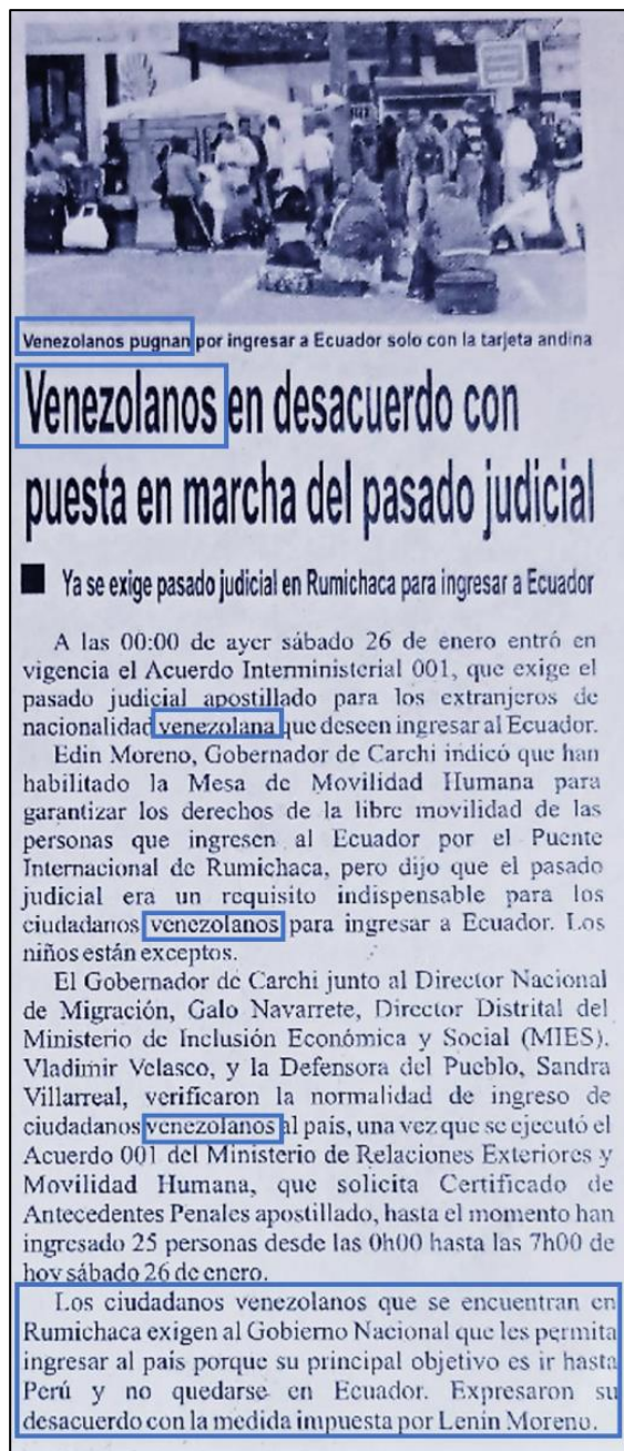
Figura 5. Nota 4 Diario La Nación.

En el análisis de los artículos se hace evidente el uso de estrategias de carácter cognitivo, las cuales dan significado al relato discursivo otorgándole al texto elementos de veracidad sobre el hecho que se difunde. Las intenciones pueden estar enfocadas en cumplir el rol de informar, al ser un medio de comunicación importante en la ciudad de Tulcán. El propósito es mostrar la realidad de migración venezolana desde las problemáticas que esto genera a nivel social, principalmente en lo relacionado al tema de seguridad.