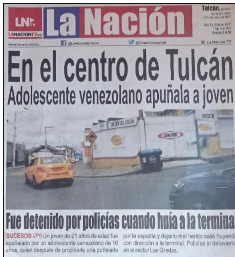
Figura 1. Portada Diario La Nación

Las notas siguen una estructura sencilla, en cuanto al uso del lenguaje y a la construcción de las oraciones, esto facilita que el lector comprenda las ideas y mensajes que se busca dar a conocer. En cierta medida se trata de un medio o fórmula que funcionan correctamente en el afán de comunicar ideas que terminan construyendo representaciones sociales que se reafirman dependiendo de la perspectiva o contexto desde el cual son leídas.