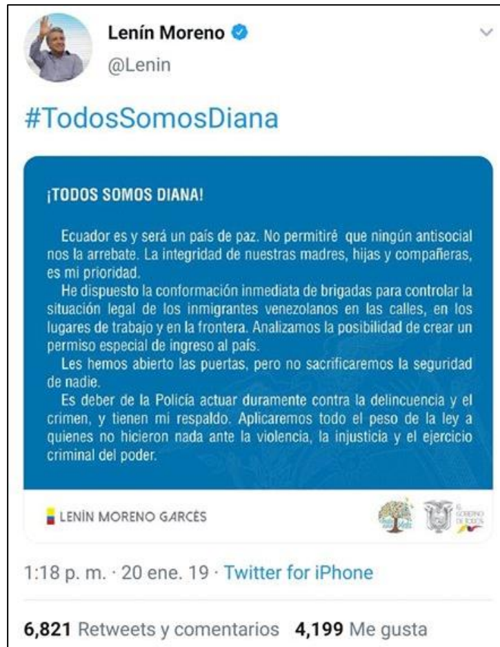
Figura 4. Mensaje de Lenin Moreno.

La declaratoria del presidente Lenin Moreno, dio paso a la firma del Acuerdo Ministerial 001, en el que se exige como requisito para ingresar al Ecuador, que los ciudadanos venezolanos cuenten con el pasado judicial apostillado. Situación que vulneraba su derecho a la libre movilidad, tomando en cuenta la realidad en la que se encuentra Venezuela y la dificultad de realizar cualquier tipo de trámites en ese país así como el tiempo que se tardaría en obtener este documento.