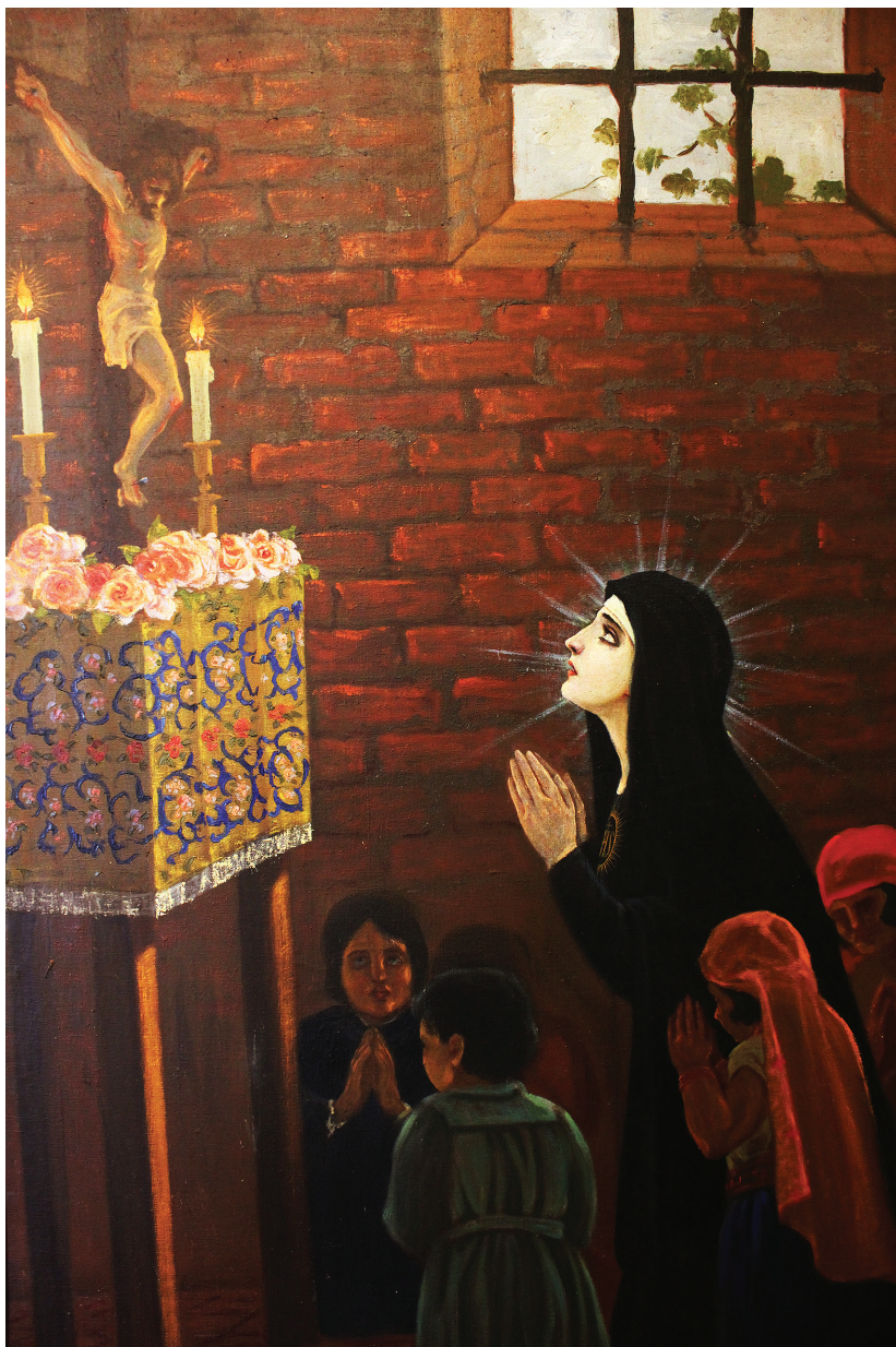
Figura 3. Víctor Mideros, "III EN EL VALLE DE LA ORACIÓN ENSEÑANDO EL A, B, C, DE LA CIENCIA DE LA VIDA", óleo sobre lienzo, 202 x 110,50 cm. Quito: Museo del Carmen Alto, 1925.