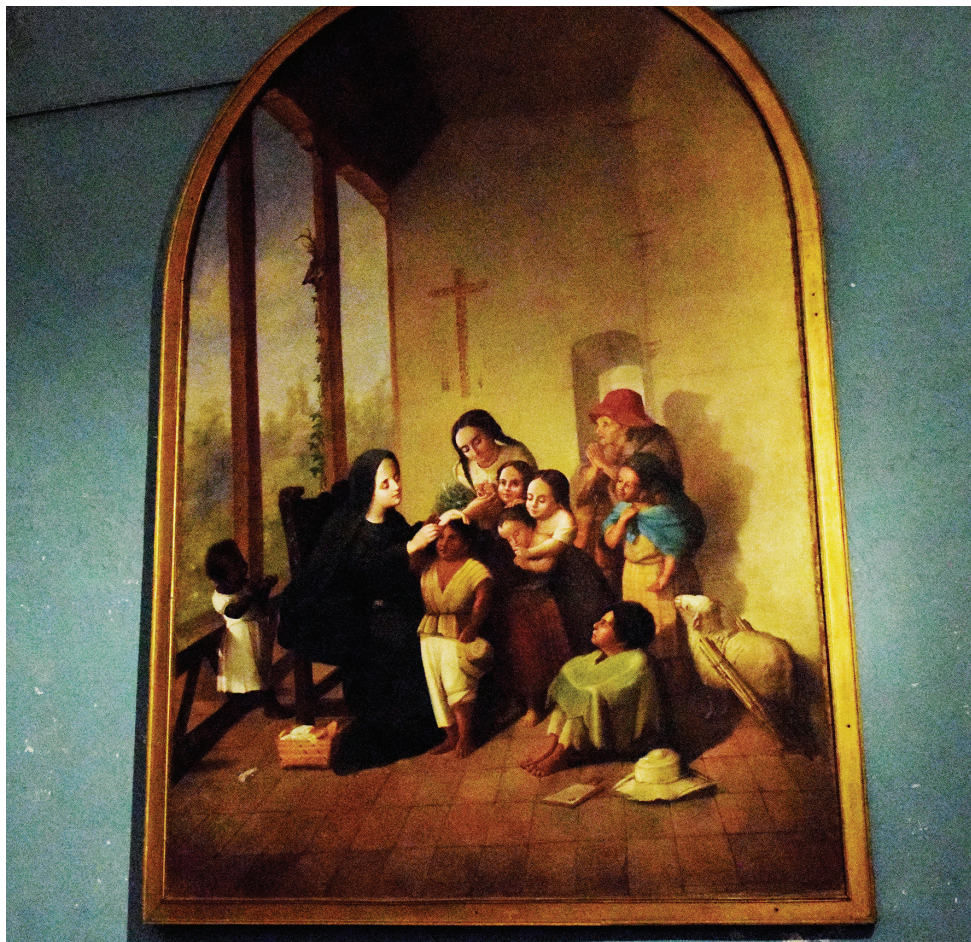
Figura 4. Joaquín Pinto, “Santa Mariana Catequista”, óleo/lienzo, 124 x 93 cm. Quito: Museo Nacional (MuNa), 1985.