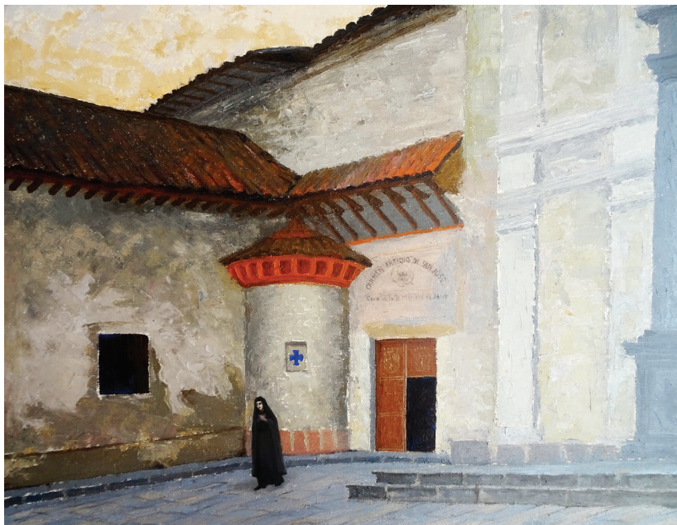
Figura 2. Víctor Mideros, “Carmen Antiguo de San José: Casa de la B. Mariana de Jesús”, óleo/lienzo. Quito: Biblioteca Espinosa Pólit, 1927.