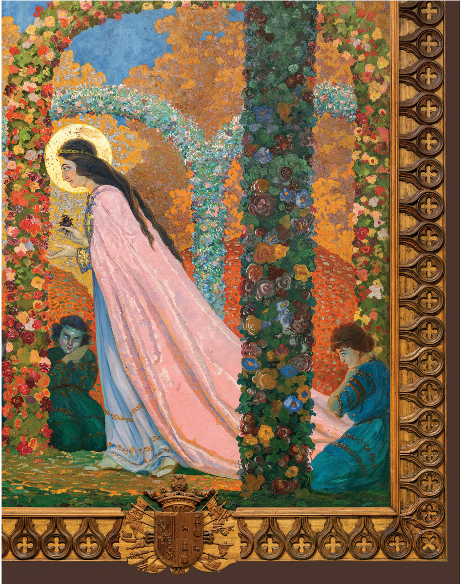
Figura 1. Víctor Mideros, “Virgen de las Violetas”, óleo/lienzo, 270 x 230 cm. Quito, 1922.