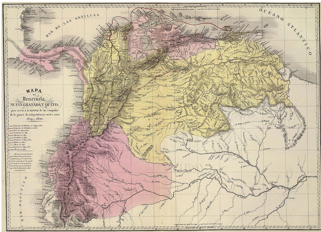
Mapa 1. Mapa de Venezuela, Nueva Granada y Quito, 1840