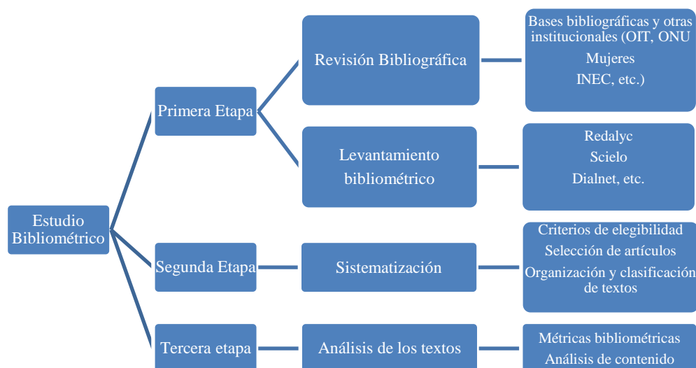
Figura 1. Esquema gráfico del diseño metodológico Fuente y elaboración propias

Esta tesis desarrolló el siguiente modelo metodológico, que se ilustra en la figura 1.