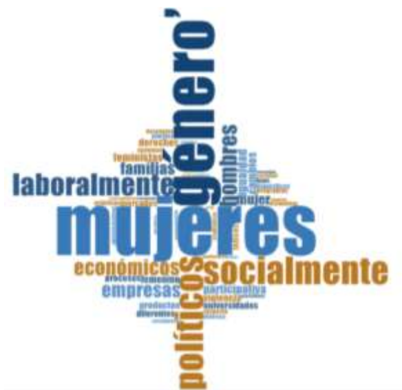
Figura 3. Nube de 50 palabras más frecuentes

La exploración de los textos fue realizada inicialmente con la identificación de las 50 palabras más frecuentes, cuya longitud mínima fue 5 caracteres. En seguida se procedió a depurar el resultado, excluyendo palabras que no tenían ningún significado y que en el programa les nombran como palabras vacías . Se decidió también usar el criterio de palabras diferentes, que tengan la misma raíz. El resultado de esta consulta global se ilustra en la figura 3 a continuación.