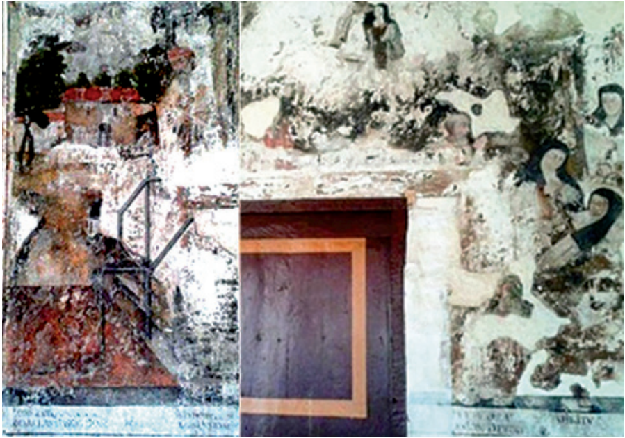
Figura 3. Anónimo, Sanación por intercesión de San José , siglo XVIII.