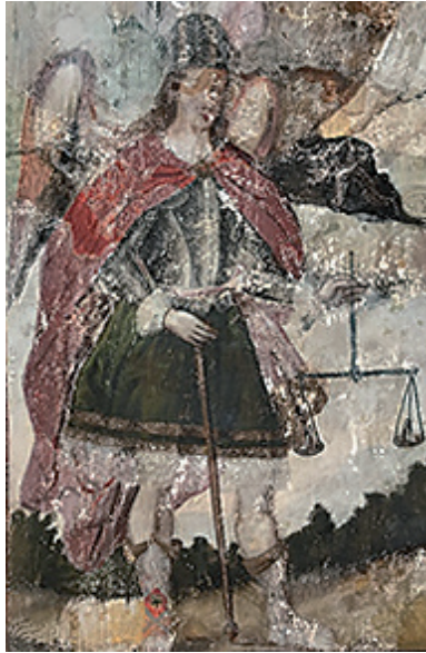
Figura 9. Anónimo, Detalle del arcángel Miguel , siglo XVIII.