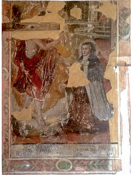
Figura 7. Desposorios místicos , siglo XVIII.