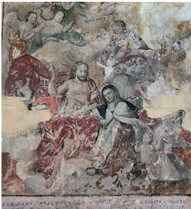
Figura 12. Anónimo, Visión de la Trinidad , siglo XVIII.