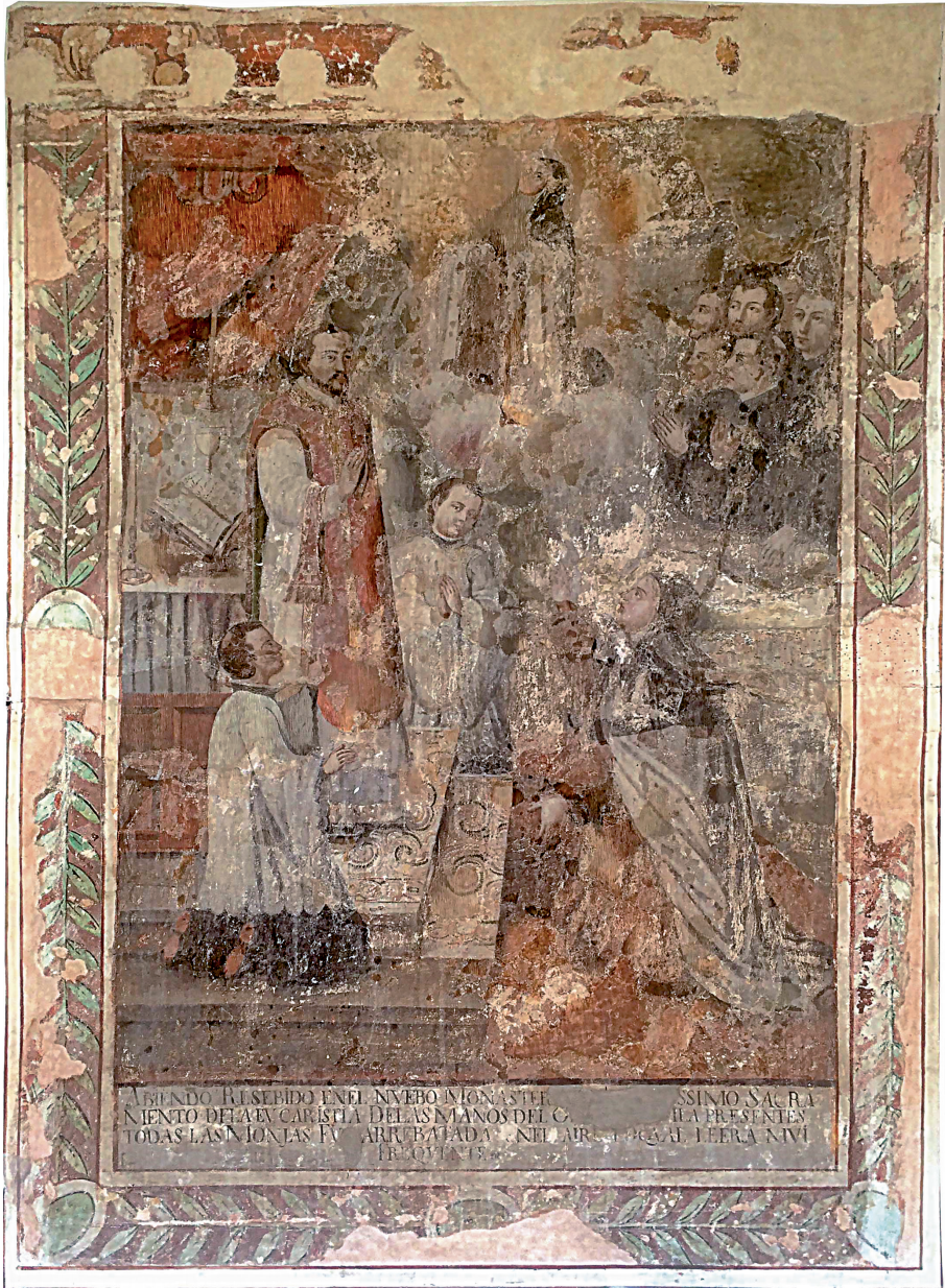
Figura 10. Anónimo, Arrobo ante la Eucaristía , siglo XVIII.