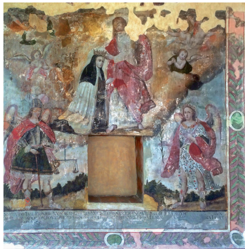
Figura 8. Anónimo, Coronación , siglo XVIII.