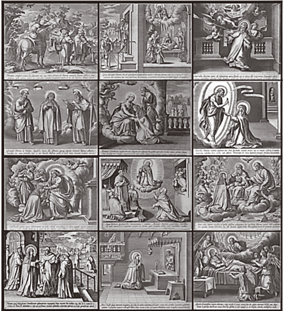
Figura 1. Varios de los grabados que componen la serie “Vita B. Virginis Teresiae a Iesu”, siglo XVII.