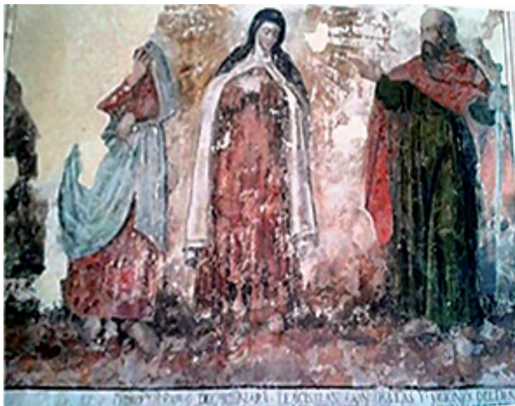
Figura 5. Anónimo, Visión de San Pedro y San Pablo , siglo XVIII.