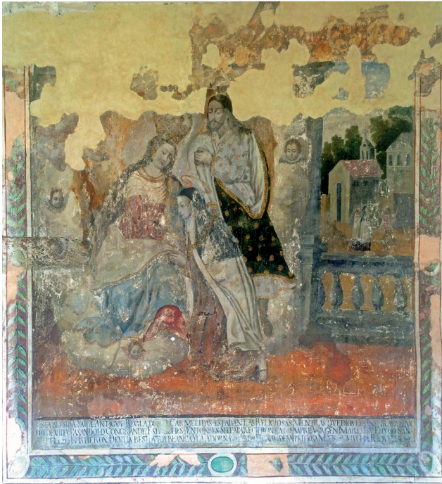
Figura 6. Imposición del manto y el collar , siglo XVIII.