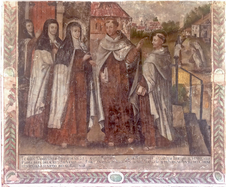
Figura 11. Anónimo, Fundación de la rama masculina de Carmelitas Descalzas , siglo XVIII.

do, se divisa a la santa indicando a ambos clérigos, cuáles serán las casas donde se erigirá el primer conventillo para hombres.