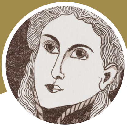
Manuelita Libertadora, Luciano Mogollón. Colección UASB-E.