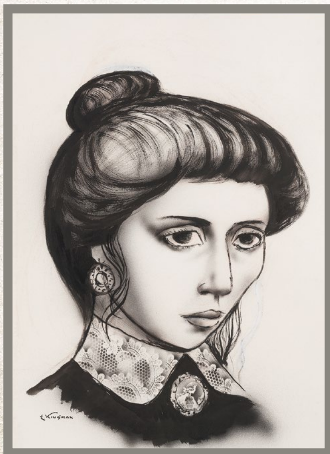
MANUELA SÁENZ Eduardo Kingman S/f 76 x 53 cm Aguatinta sobre papel