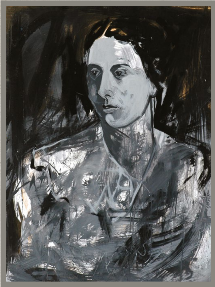
MANUELA SÁENZ Pilar Flores 2010 74 x 59 cm Témpera sobre cartón