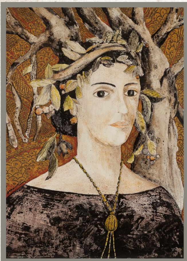
MANUELA, LA ILUMINADA Marco Martínez 2010 61 x 46 cm Técnica mixta sobre madera