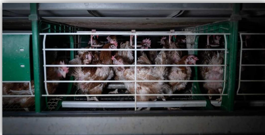
Figura 1. Gallinas ponedoras dentro de jaulas.

la máquina a las gallinas? Al menos lo es en cierta parte, pues, aunque no se las destine para otras actividades, las gallinas, incluso encerradas, pueden realizar acciones por fuera de la técnica. En la Figura 1, el simple hecho de que las gallinas estén paradas, mirando como distraídas hacia distintas direcciones, como si estuvieran en un descanso o no supieran qué hacer, todo eso las ubica fuera de la técnica. Sus cacareos, acciones fuera del proceso de producción, también estarían fuera de la técnica, porque esta suprime todo lo que no sea parte del procedimiento.