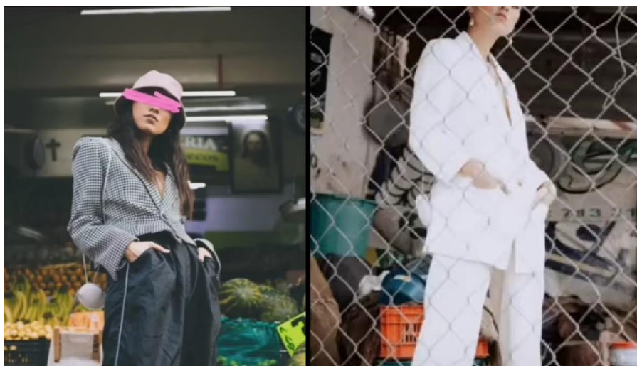
Figura 2. Fotografías donde predomina la técnica de apareamiento por sobre todo lo demás

expresión perdida de las gallinas parecerá signo de estupidez. Sin embargo, el agotamiento de una selfie humana podría derivar precisamente de que es toda ella técnica de apareamiento. Y dado que la técnica suprime todo lo que no sea ella misma, la selfie puede convertirse en una expresión estéril, una demostración de técnica más, donde no hay más que observar que la propia técnica siendo técnica; ni siquiera al ser humano en la foto.