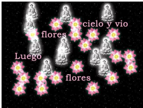
Figura 3. El jardín... es algo que no se puede serializar, algo que termina, algo que no ha caído en un pozo sin fondo

subir contenido y no existe la interconectividad, la acumulación ni la anulación del inicio y el fin (en redes no existe un inicio y un fin, por cierto).