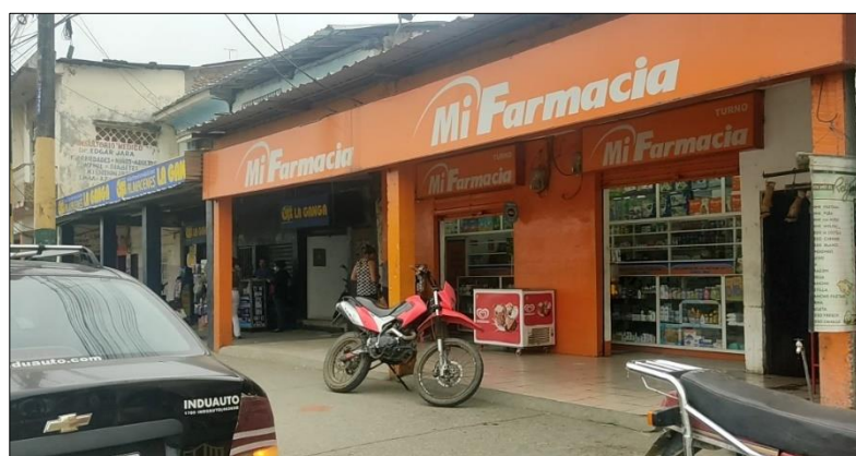
Figura 3. Locales comerciales frente al edificio municipal.

Las circunstancias del centro de Samborondón son diferentes en relación a las circunstancias en las que se perciben en los recintos, existe la intervención municipal mucho más pronunciada. Este espacio comparado con la zona urbana de la puntilla parece un barrio con muchas carencias, en el que encontramos ciertos sectores con atención municipal como las vías que conecten con la carretera principal, el malecón que bordea el río, el palacio municipal, algunos centros de recreación como coliseos o canchas de fútbol. Sin embargo, las edificaciones en general son de máximo dos o tres pisos de altura. Mientras que los locales comerciales se ubican en casa adaptadas para este fin.