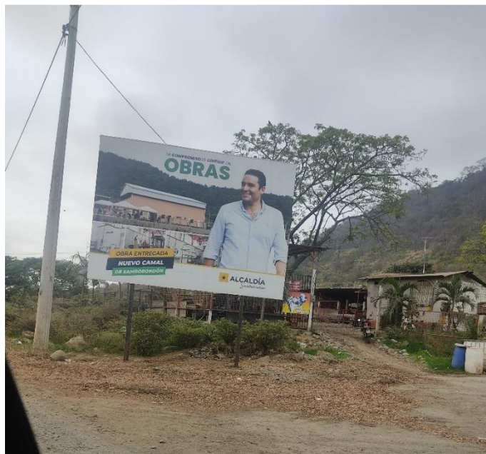
Figura 2. Sector Santa Ana- Samborondón, cerca del Camal. Se aprecian las características rurales de los recintos

Por otro lado, la vía que atraviesa los diversos recintos (La Patricia, Nueva Angélica, Santa Rosa, La Sequita, El paraíso, etc.) es un camino tortuoso para quienes lo utilizan, para conductores es de difícil tránsito debido al estado, es una vía asfaltada en la que hay baches de gran tamaño y otros espacios en los que los baches se han rellenado con piedras que generan molestia en la utilización del camino, lo que puede justificar el aumento del tiempo en transitar ese camino; para los peatones, también genera dificultad por la gran cantidad de polvo que se levanta en el carretera; además es importante mencionar que el alumbrado público aparenta deficiencia en la cobertura del camino. En relación a los medios de transporte, encontramos pocos caballos, mayoritariamente la presencia de bicicletas, motos y tricimotos, en el transcurso de una hora pasaron solo 3 buses en dirección de Samborondón a Salitre, ninguno en sentido contrario; previo al Cerro Santa Ana, encontramos la salida de volquetas que transportaban piedras extraídas de una elevación.