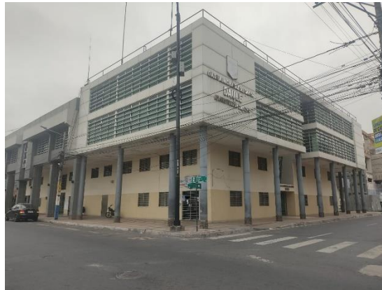
Figura 9. Edificio municipal Daule

Frente al edificio municipal encontramos la plaza central que, desde tiempos coloniales, conecta con algunas de las instituciones principales del cantón, la iglesia principal, un banco estatal, el cuerpo de bomberos. En el centro de esta localidad se haya a los referentes históricos del cantón relatados a través de esculturas y paneles informativos. La dinámica cantonal, muestra el uso de transporte público cantonal e intercantonal, así como el uso particular de motos, bicicletas y tricimotos para movilización interna.