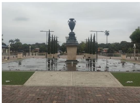
Figura 8. Fuente de agua en la plaza central sobre el malecón.

Lo que encontramos al recorrer la capital arrocera del Ecuador, como es conocido este cantón, es una avenida principal característica del modelo de la autoestima socialcristiana. Una avenida de cuatro carriles con una jardinera central con pequeños árboles, los cuales de acuerdo a las llamada reforestación que hace la alcaldía pueden responder a especies tales como “Pechiche, Guachapelí, la Seca y Laurel Negro” (Alcaldía de Daule 2020), muchas luminarias públicas que acompañan en su longitud esa avenida que se extiende en el ingreso y salida del cantón.