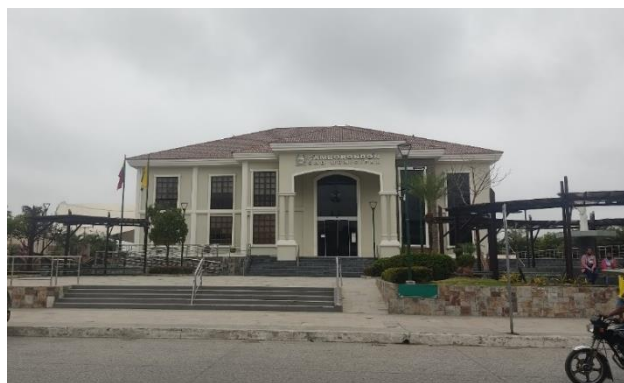
Figura 4. Edificio municipal de Samborondón sobre el malecón.

El edificio municipal busca representar la modernidad y progreso que la administración transmite en La Puntilla mientras que en frente y en los sectores aledaños, se percibe el desorden en la provisión de servicios públicos como electricidad y alumbrado; el malecón busca atraer la vista hacia el río Babahoyo, este lugar se vuelve artificial el espacio natural con la poca presencia de vegetación y prevalecía de esculturas y distracciones metálicas o de cemento.