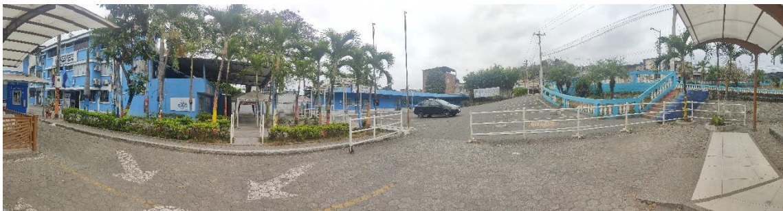
Figura 6. Edificio municipal de Durán.

De los últimos veintidós años, durante catorce, el cantón Durán ha tenido administración socialcristiana. Sin embargo, el cantón no puede compararse con una urbe en progreso. El aspecto de sus edificaciones tiene apariencia antigua, construcciones en el centro aún pueden apreciarse con características mixtas, la altura máxima de las viviendas de 3 pisos, los edificios no tienen gran representatividad. La edificación municipal, la que se esperaba tuviera una apariencia moderna, en razón de la dimensión territorial y habitantes del cantón, tiene una apariencia ciertamente básica.