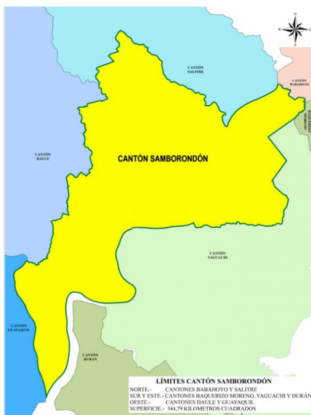
Figura 1. Mapa de Samborondón 2020