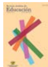
Tabla de contenidos

http://revistas.uasb.edu.ec/index.php/ree