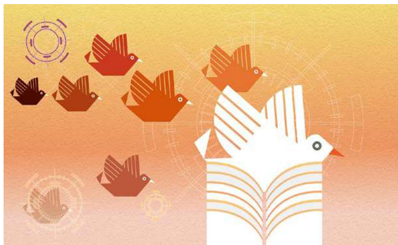
Ilustración: Belén Mena