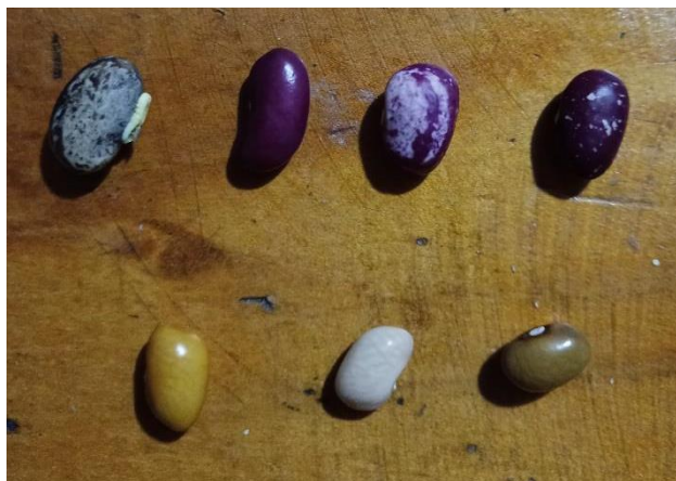
Figura 18. Semillas diversas de frijoles

e intercambiado, adaptándolas a condiciones geográficas y climáticas diversas y a necesidades culturales y socioeconómicas propias de cada pueblo.