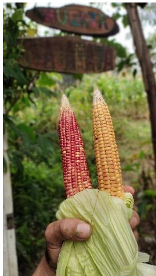
Figura 9. Maíz de colores cosechado en la Huerta Guacamaya

Según investigaciones arqueológicas “se ha logrado evidenciar un poblamiento que se remonta a más de diez mil años antes del presente” (Botero 2021, 18) desde la confluencia del río Grande que recoge al Aburrá, a lo largo del Cañón que confluye en el río Porce. Según la arqueología, desde hace diez mil años empezaron incursiones de grupos humanos desde el río Magdalena hasta llegar al Valle de Aburrá. Siete mil años después esta red de ríos habitada por distintas gentes, amigas o enemigas, conformaban “una intrincada red de caminos [que] alcanzaba montañas y valles en todas direcciones que, como manos y pies, comunicaban con facilidad los tres grandes ríos y las gentes asentadas en sus cuencas” (Botero 2021, 21). Esta memoria del territorio nos revela una parte de nuestra historia profunda como habitantes del Valle de Aburrá que ha quedado encubierta en los relatos oficiales modernos de la nación.