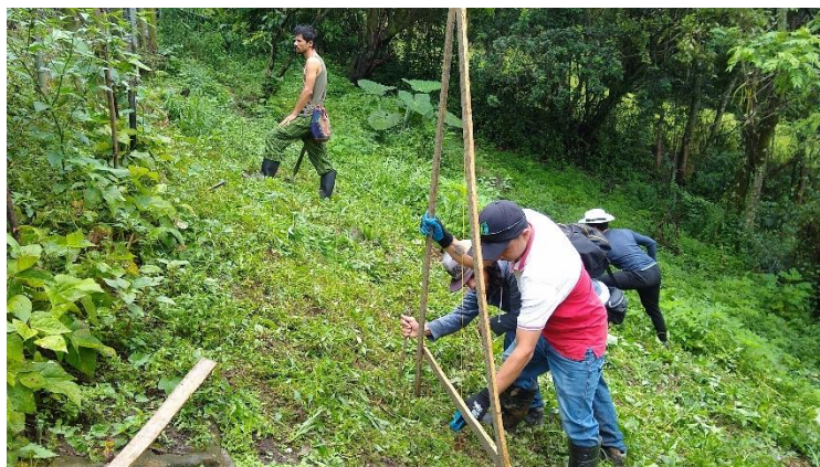
Figura 7. Jornada de siembra con agro nivel

Pero también desde un principio han estado infinidad de plantas, insectos microorganismos, animales que vamos haciendo cada vez más conscientes como parte del territorio, reconociendo su papel ecosistémico en estos espacios como sus potenciales alimenticios, medicinales, espirituales y simbólicos. En ese sentido en la huerta hay unos grandes árboles nativos como los carnavalitos ya que florecen en la época de carnavales. Su nombre científico es Senna spectabilis , tienen entre 30 y 50 años y hacen parte de un entorno de bosque que se cierra en la huerta.