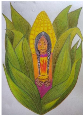
Figura 15. Ilustración de la imagen de la primera Fiesta del maíz en la Huerta Guacamaya