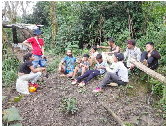
Figura 16. Círculo de palabra en jornada de siembra en la Huerta Guacamaya