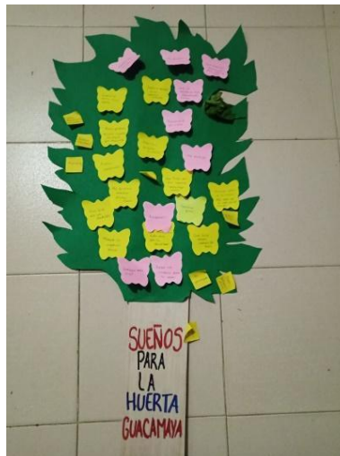
Figura 20. Conectando sueños en el barrio Guacamaya

Sembrar muchas cosas como cebolla y tomate, maíz, frijol, ahuyama, hortalizas, legumbres, plantas medicinales, árboles frutales y árboles de sombra [...] Que haya prosperidad, que se cuiden las plantas y los animales, y aprender a manejar los desechos orgánicos [...] Ver florecer la huerta como siempre [...] Y hacer una maloca o casa de pensamiento y un parque [...] Vivir bien acá en Medellín. (Sueños colectivos 2025, conversación personal)