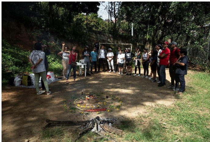
Figura 17. Jornada cultural en la Huerta Guacamaya

Tras la experiencia de sembrar en colectividad y comunidad, se van intercambiando conocimientos que devienen en comprensiones propias que se reflexionan en la Huerta Guacamaya, pero también con otras huertas comunitarias con las que cooperamos expandiendo la acción huertera como aulas vivas de re-existencia, expandiendo un sentido de comunidad ampliada, tal como se muestra en la imagen anterior.