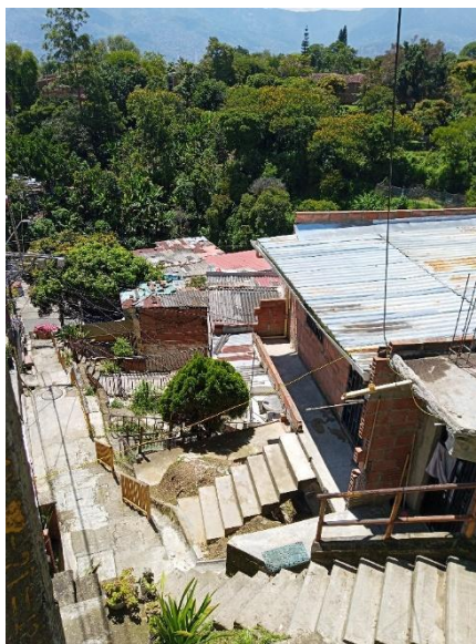
Figura 1. Sector la colina y zona verde donde está la Huerta Guacamaya

De esta forma, se va conformando una territorialidad popular, mestiza y urbana con un legado interancestral de saberes, prácticas y formas cotidianas de vida, aparentemente ocultas entre la normalización de lo “obvio”, que se van trenzando en vínculos y contradicciones con la vecindad conformada por gente diversa de muchas partes del país y de la región, generando formas nuevas de re-existencia en el barrio a partir de la siembra y legitimando la tierra baldía de forma colectiva para un fin familiar o comunitario, al mismo tiempo, se generan procesos de cuidado y dialogo con la flora y fauna creándose espacios bioculturales de ciudad. Desde la idea de interancestralidad se comprende que el mestizo popular urbano está revestido de legados ancestrales de diferentes pueblos como afrodescendientes, indígenas, campesinos, y no solo europeos. Siendo el producto de un proceso de opresión, negación y re-existencias de saberes y prácticas diversas que se tratan de resignificar como horizonte de liberación en un sentipensar con lo vivo.