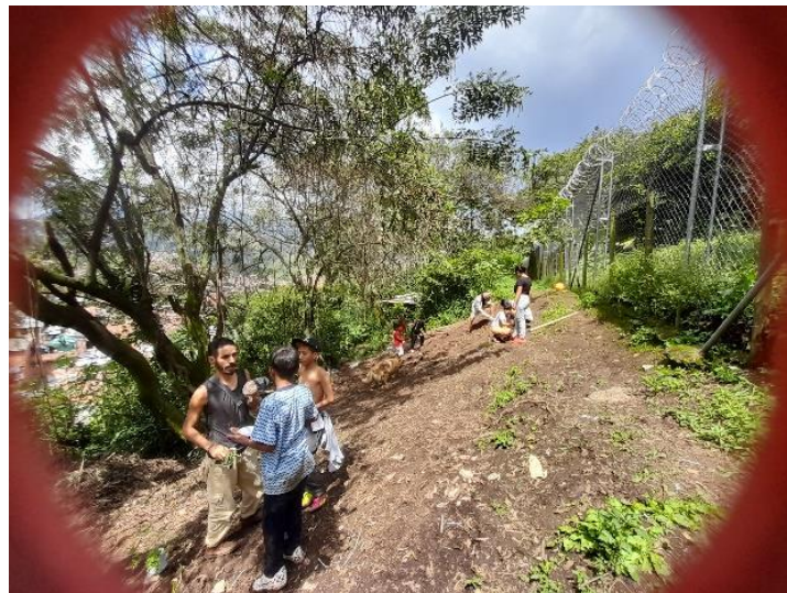
Figura 8. Jornada de siembra en la Huerta Guacamaya