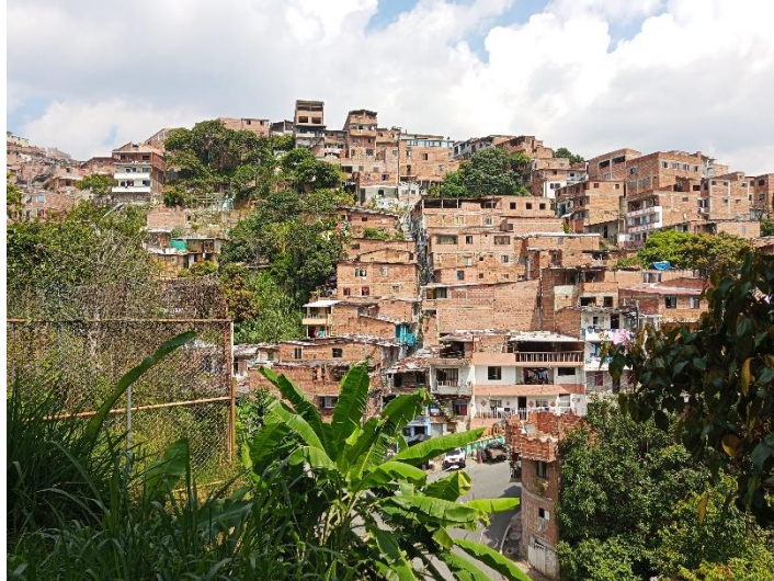
Figura 3. Sector Guacamaya (antes el hueco), en el barrio 20 de Julio