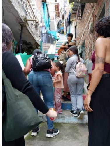
Figura 19. Conectando sueños en el barrio Guacamaya

Subiendo y bajando por las escaleras entre los callejones del barrio de ladera, compartiendo sueños en forma de dulces de banano y avena que le fascinó a la gente, se recogieron sueños comunitarios para la huerta como: