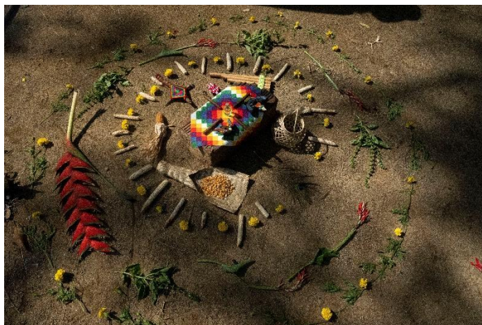
Figura 14. Espiral de ritual de siembra y conexión con la huerta y el territorio

En esa medida, nuestro lugar de enunciación se ubica desde la comprensión de una temporalidad en transformación que implica volver al futuro para tejer la memoria del territorio, es decir, mirar atrás para tejer algunos trozos de nuestra ancestralidad borrada permitiendo que emerjan trazos de las fuerzas vitales que nos conectan con la defensa, cuidado y liberación de la Sagrada Tierra, los pueblos y los animales.