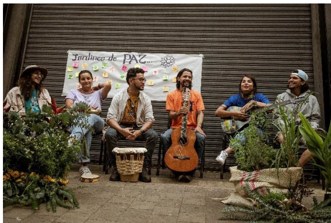
Figura 5. Colectiva Pachakutik en una presentación musical de Iniciativas de paz en el Museo Casa de la Memoria