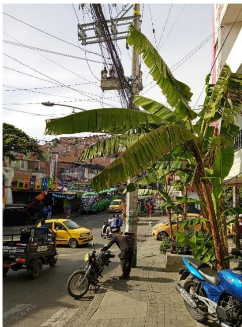
Figura 13. 20 de Julio, platanera en la entrada a la zona turística del barrio las Independencias I

Por otro lado, algunas personas del barrio como Miro, un mestizo popular urbano con un legado campesino muy marcado, algo así como un campesino urbano, da cuenta de estas relaciones de pervivencia de la memoria del territorio a lo largo de varios encuentros y algunos círculos de palabra que hemos podido compartir junto a estudiantes y otros integrantes de la Colectiva Pachakutik.