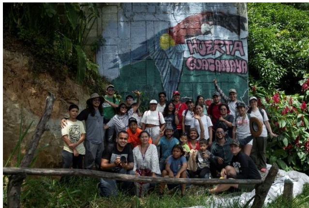
Figura 2. Recorrido territorial por la Huerta Guacamaya

La metodología de este trabajo fue de corte cualitativa, indisciplinada, sentipensante y comprometida con la vida. En esta ecoinvestigación se teje un proceso de aprender-haciendo con otros y otras a partir de las dinámicas huerteras con la colectiva Pachakutik, las acciones de minga y círculos de palabra con otros procesos. Por un lado, se realizaron entrevistas personales y en compañía de estudiantes de la Universidad de Antioquia (UdeA) que vienen haciendo su tesis de pregrado en Trabajo Social con la Huerta Guacamaya y, por el otro, la coinvestigación Huertas comunitarias para los buenos vivires (Galindo Gómez et al. 2025) realizada con el semillero de investigación que coordino Wêt Wêt Fxi'zenxi –hablemos de los buenos vivires– adscrito al grupo de investigación en Estudios Interculturales y Decoloniales (GIEID), de la Universidad de Antioquia.