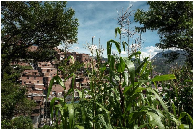
Figura 10. Maíz florecido en la Huerta Guacamaya

Sentipensando el barrio donde vivo se percibe como se marcan las fronteras entre el campo y la ciudad, a través de lucecitas que titilan alumbrando trozos de montaña haciendo figuras extrañas que contrastan con la oscuridad de la noche. Con los años la frontera de la ciudad se ha ido extendiendo hacia los altos-medios de las laderas de la cordillera, la gente racializada y empobrecida en sus procesos de migración por violencia política y/o estructural salen de sus territorios en busca de oportunidades cerca de la urbe, encontrado en este sector un refugio para echar raíces otra vez y vivir allí después del despojo acaecido. Lo que antes era verde montaña ahora es color ladrillo y gris cemento, sin embargo, la relación con la tierra no se pierde, se sostiene y se repliega, 8 así como se puede apreciar en la foto.