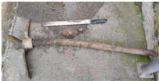
Figura 4. Machete, pica y palustre, las primeras herramientas para sembrar

Un día de septiembre, del 2021, nos encontramos Alex y yo, conseguimos un pedazo de machete oxidado y sin cachea, un palustre sin mango y una cabeza de una pica donde mi abuelita Resfa y fuimos a sembrar un palito de aguacate que germinó en la composta de mi casa en el barrio Campo Valdés, el cual llevé atravesando la ciudad en bicicleta, de oriente a occidente, hasta el baldío de la huerta.