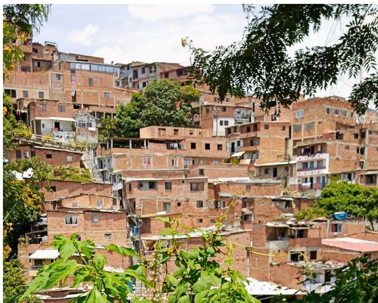
Figura 12. Vista del árbol de aguacates en el sector la Colina y el Hueco del barrio 20 de Julio

Antes de los años setenta se sembraba en este sector, varios testimonios dan cuenta de la finca de Crispiniano y los sembrados de café, pomos, plátano, naranjas, guayabas, entre otros alimentos que crecían en estas montañas. En ese tiempo había diversos afluentes hídricos, nacimientos y una biodiversidad de fauna y flora que habitaban este territorio.