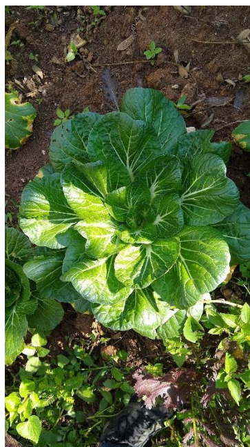
Figura 21. Acelga sembrada en la Huerta Guacamaya

Otro aspecto a señalar es que en el territorio se sembraba antes de la colonia, tras las independencias, durante el proceso de modernización, urbanización e industrialización, y aún ahora, cuando las semillas las han tratado de privatizar la gente sigue sembrando hasta en la ciudad, pero también siembran las aves y el viento que dispersa semillas por los aires que caen de los árboles. Es así como en el amanecer de otros mundos posibles sembrar la vida será un horizonte para organizarnos como ecosociedad con la tierra y lo vivo, yendo más allá de lo humano y lo social. De esta forma, se teje un pensamiento con lo vivo como legado presente de la pervivencia interancestral que nos dejan los pueblos diversos, las aves y el viento.