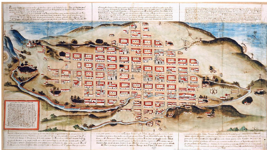
Figura 1. Plano de la ciudad de La Plata, 1779

Para comprender la división espacial en Sucre y la presencia de los artesanos en la ciudad se asume la postura de Ayllón quien afirma que, “[...] la experiencia social del espacio tiene siempre una connotación simbólica que es producto de sus relaciones de poder, de las relaciones de jerarquía establecidas a su interior [...]”. En este sentido, cabe señalar que Sucre, una vez constituida la república, mantuvo la estructura de damero heredada desde la colonia, cuya división simbólico-espacial concentró en el centro de la ciudad los edificios gubernamentales y las viviendas de las élites criollas.